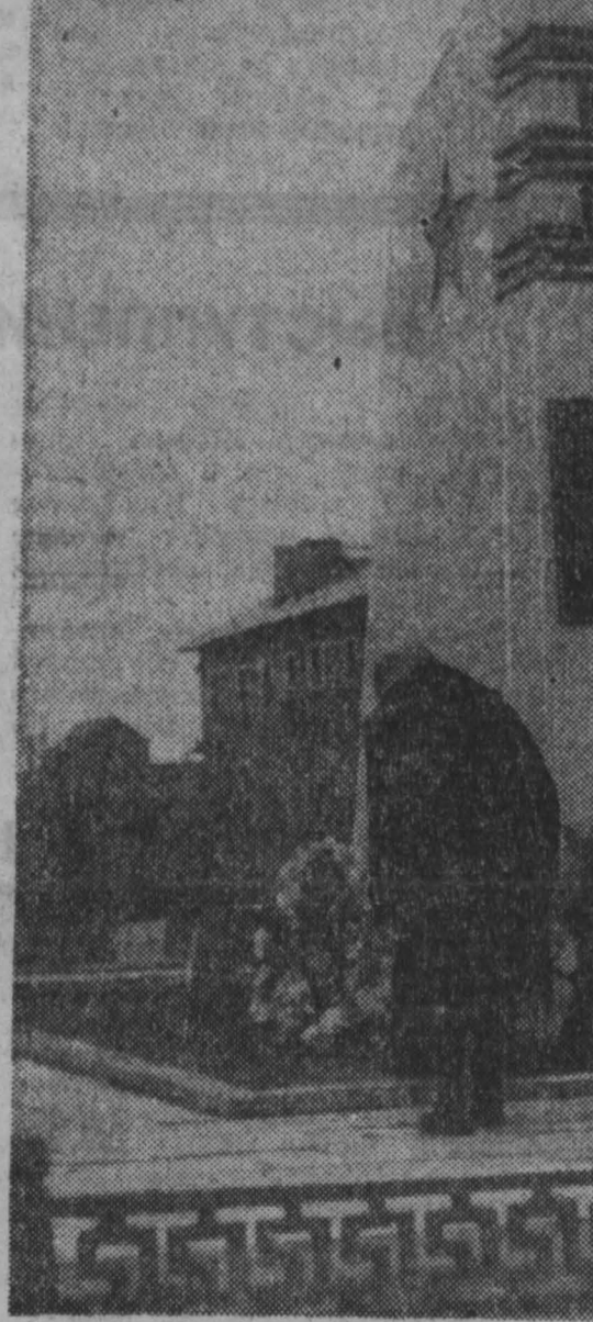
Фото В. Данилова. Ленинск-Кузнецкий район.

На центральной усадьбе совхоза «Возвышенка» — в поселке Мирном — открыт памятник воинам-землякам, погибшим в годы Великой Отечественной войны.