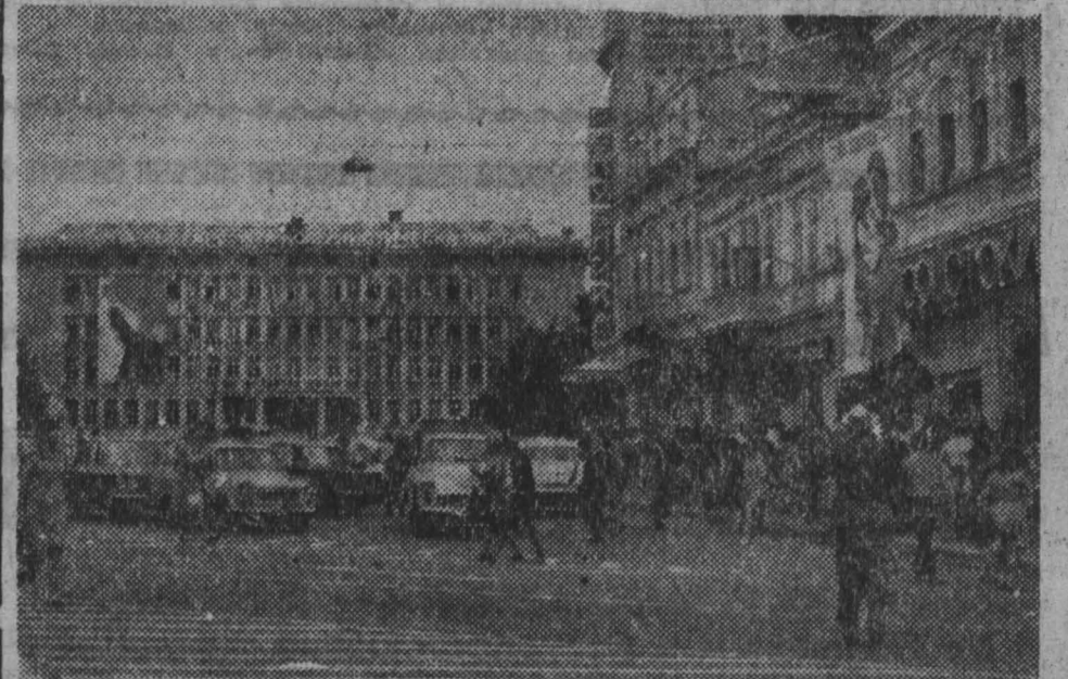
Центральная площадь в Варне — крупном промышленном и культурном центре Болгарии.

И. Кемпный подчеркнул, что исторический опыт и особый опыт последних лет наглядно продемонстрировали, что ныне, как и всегда, Советский Союз является основной гарантией безопасности и успешного развития социализма в Чехословакии.