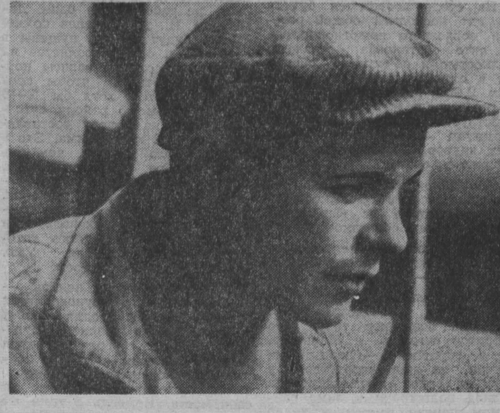
Телек и фото Евг. Багаева.