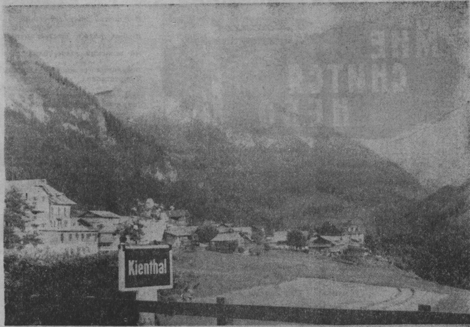
В апреле 1916 года в Кинтале — деревне в Бернских Альпах — проводилась 2-я Международная социалистическая конференция. В. И. Ленин возглавил на этой конференции левое крыло. НА СНИМКЕ: вид на деревню Кинталь.

ПАРИЖ, 23 октября. (ТАСС). Парижские газеты сообщают о торжественной встрече советских космонавтов, о митинге, состоявшемся в Кремлевском Дворце съездов.