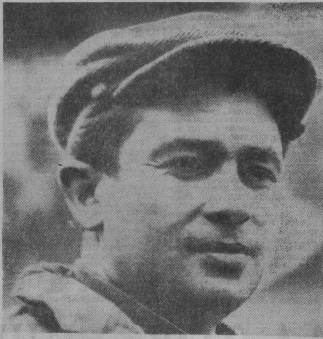
Группа народного контроля Кемеровского коксохимического завода одна из лучших в городе. Весной этого года она провела рейд по экономии энергоресурсов. Эффективную работу проводят и цеховые группы.

Народные контролеры помогли вскрыть ряд недостатков в подготовке к зиме и использовании топлива — энергетических ресурсов. Материалы проверок рассмотрены в комитетах и группах, а также в партийных организациях шахт и заводов.