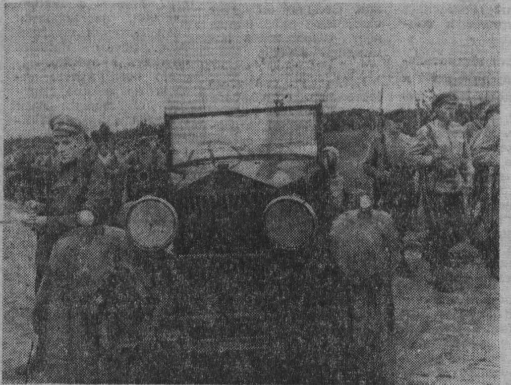
Продолжаются съемки фильма «Красная площадь», посвященного 100-летию со дня рождения В. И. Ленина. Сейчас они ведутся вблизи латвийского приморского города Лиепая. В ленте рассказывается о жизни и борьбе делега краснознаменного полка в годы гражданской войны, судьба отдельных персонажей тесно связана с созданием регулярной Красной Армии.