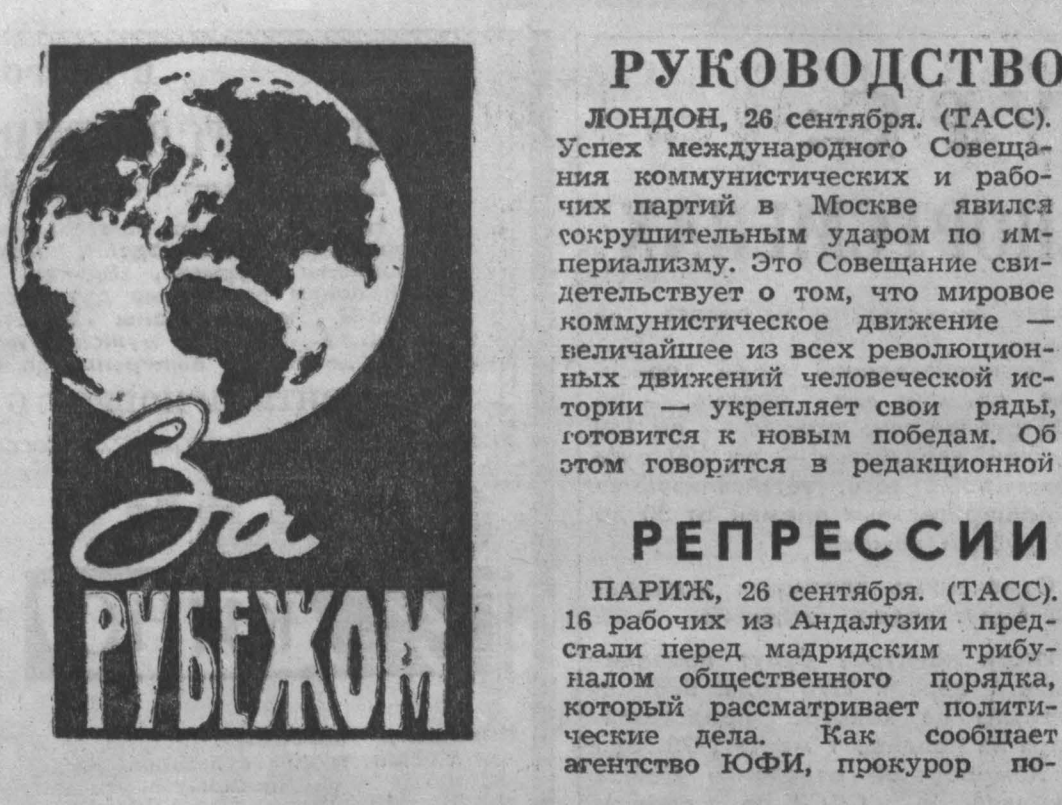
РУКОВОДСТВО К ДЕЙСТВИЮ. ЛОНДОН, 26 сентября. (ТАСС). Успех международного Совещания коммунистических и рабочих партий...