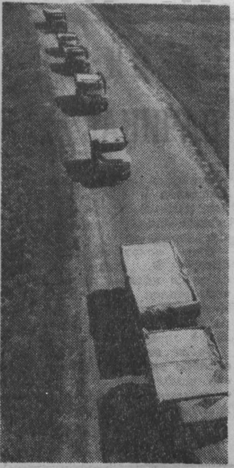
Ульяновская область. Более 300 автомашин ежедневно работает в Мелекесском районе на вывозе зерна нового урожая. Ежедневно в государственные закрома поступает до 3,5 тысячи тонн хлеба.

В честь 100-летия со дня рождения В. И. Ленина хозяйства района решили дать Родине 100 тысяч тонн зерна.