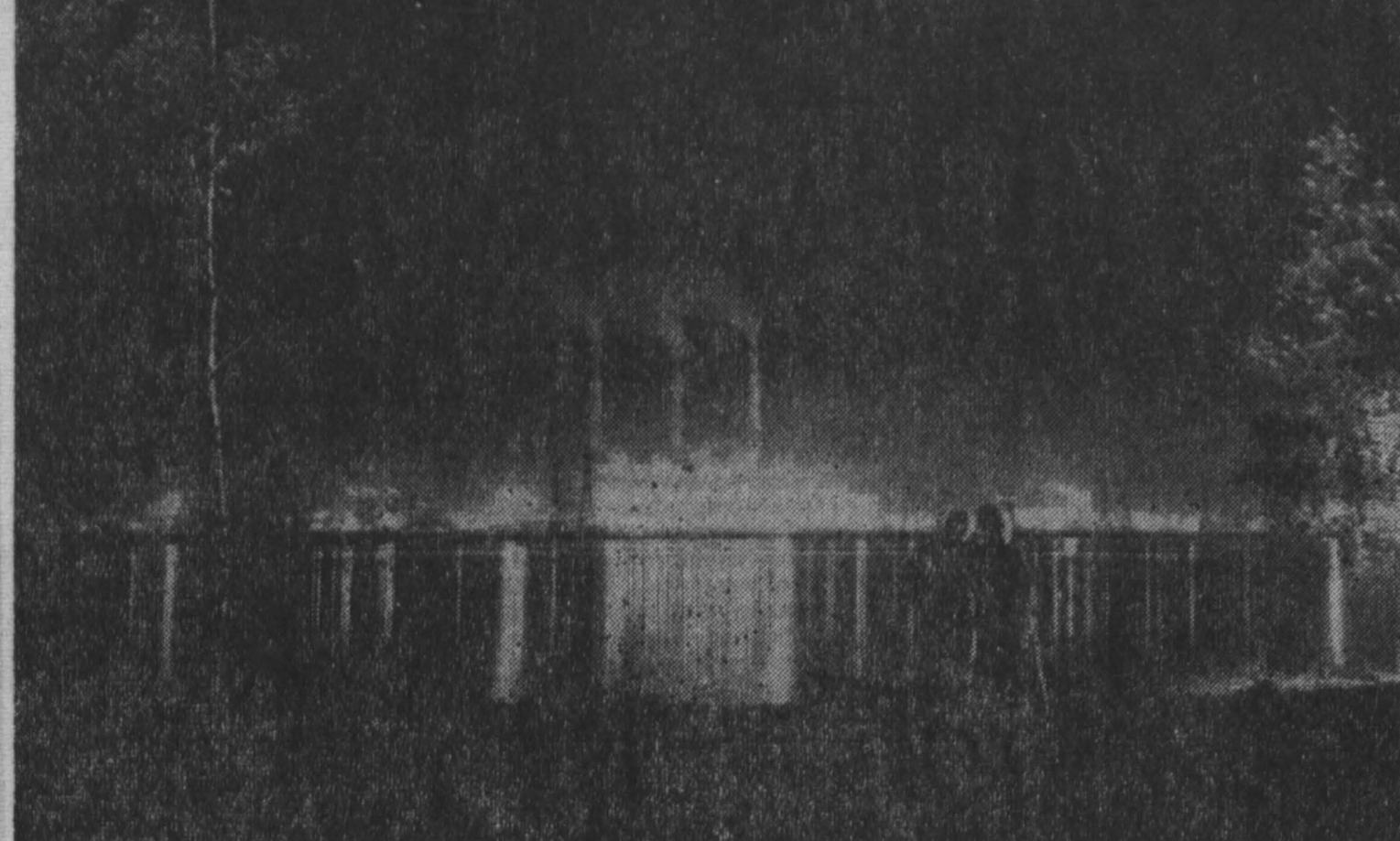
Беловская ГРЭС. Вечер.