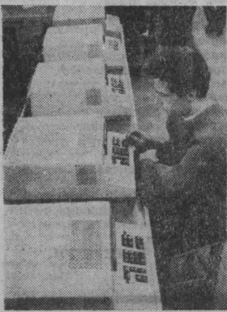
Литовская ССР. Коллектив Вильнюсского завода электросчетчиков приступил к серийному производству новых малогабаритных электросчетчиков «Раса» («Роска»). С помощью новой машины можно выполнять все арифметические действия, возводить в степень и проводить целый ряд других операций.

В честь 100-летия со дня рождения В. И. Ленина хозяйства района решили дать Родине 100 тысяч тонн зерна.