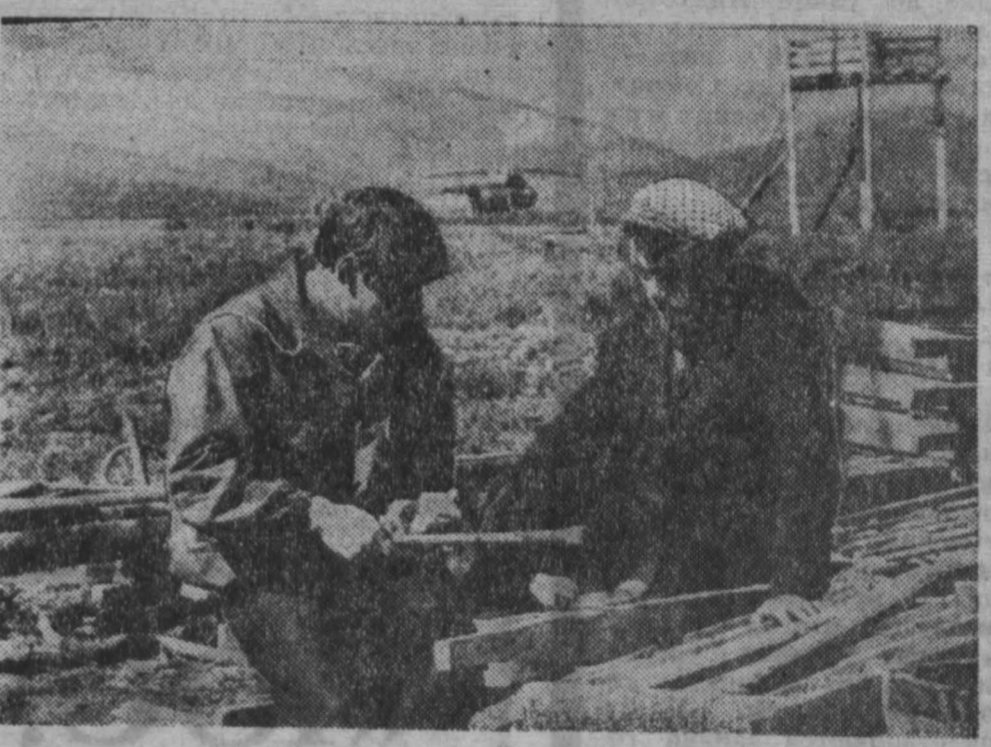
На юго-востоке Кузнецкого Алатау геологи обнаружили крупное месторождение железной руды. Детальную разведку и разработку месторождения ведет Толь-Усинская поисково-разведочная экспедиция. Сейчас на южных склонах горы Каньин полем гобой ищут поисковые работы. Геологи стараются в летнее время успеть как можно больше сделать. На дальние точки завозится оборудование, строятся зимние избушки.

Для читателей области помещены «Официальный отдел», статья А. Амзорова «Все начинается со сметы», выступление депутата Юргинского горсовета В. Воронина «НОТ — в торговлю», корреспонденция П. Аносова «И повесили прыжки...», письма в редакцию.