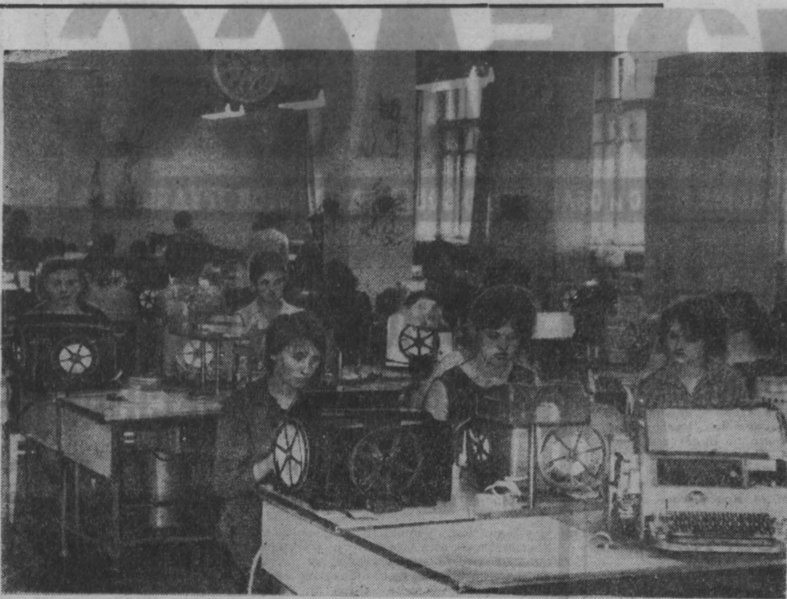
Аппаратный зал Кемеровского телеграфа.

НА СНИМКЕ: аппаратный зал Кемеровского телеграфа.