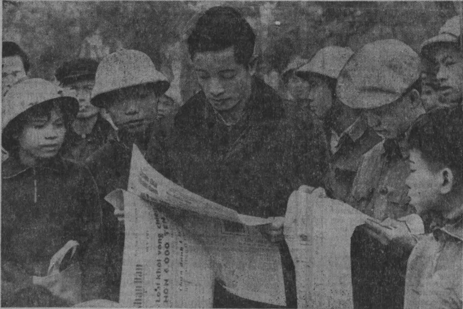
2 сентября — 24-я годовщина провозглашения Демократической Республики Вьетнам (1945 г.). Жители Ханоя быстро раскупают тиражи столичных газет. Каждого интересуют новости о боях на Юге страны, вести о трудовых победах вьетнамского народа, сообщения о жизни братских социалистических стран.

О трудовых успехах рапортуют труженики полей.