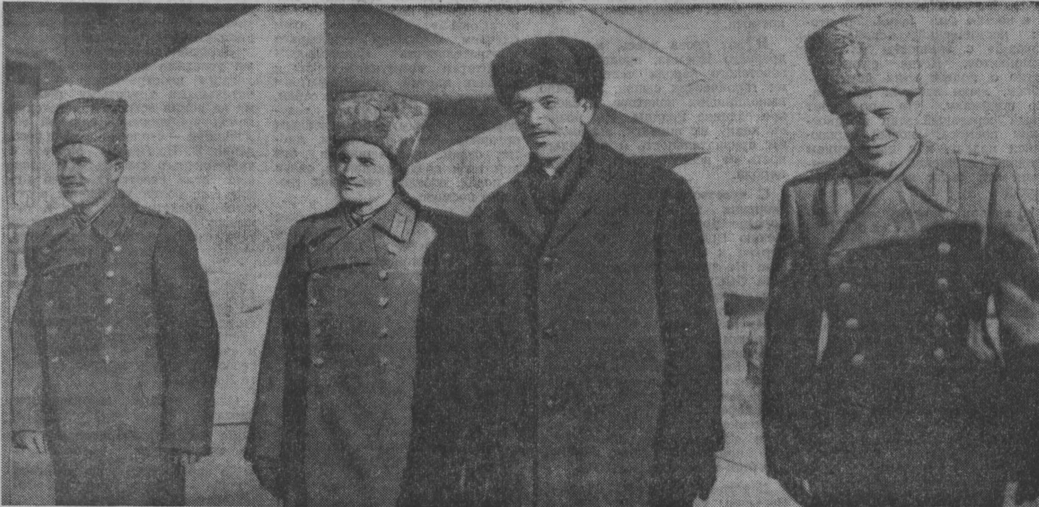
НА СНИМКЕ (слева направо) летчики-космонавты СССР, Герои Советского Союза В. А. Шаталов, Б. В. Волюнов, А. С. Елисеев и Е. В. Хрунов. (Снимок принят по фототелеграфу.)