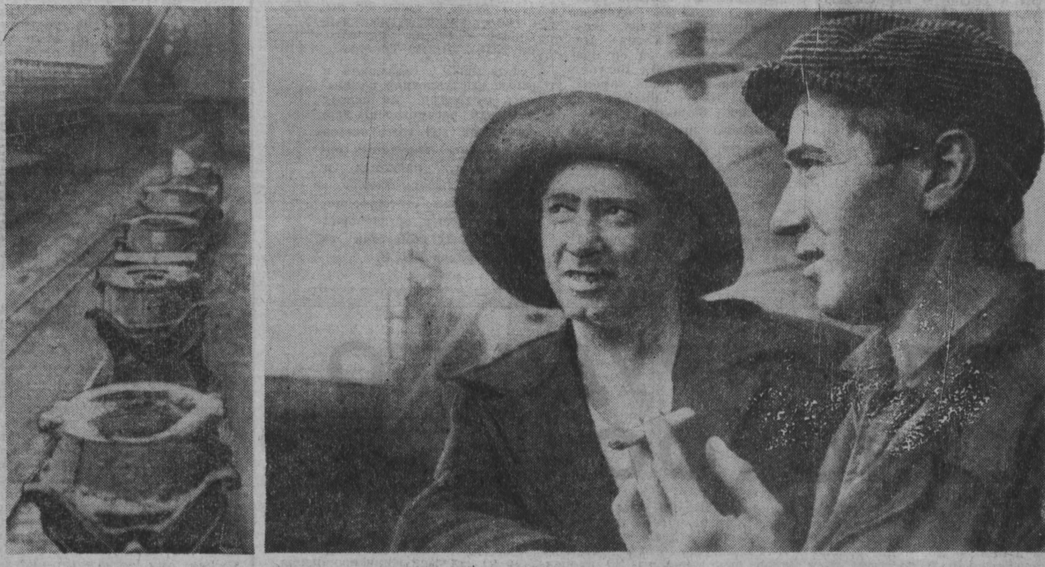
Коллектив доменщиков третьей печи Кузнецкого металлургического комбината дает стране литейной чугун. Только в августе на свой сверхплановый счет металлурги записали более 300 тонн высококачественного чугуна.

Давняя дружба связывает рудокопов Горной Шории и Криворожья. Она помогает добиваться новых успехов в социалистическом соревновании за достойную встречу 100-летия со дня рождения В. И. Ленина, в борьбе за технический прогресс.