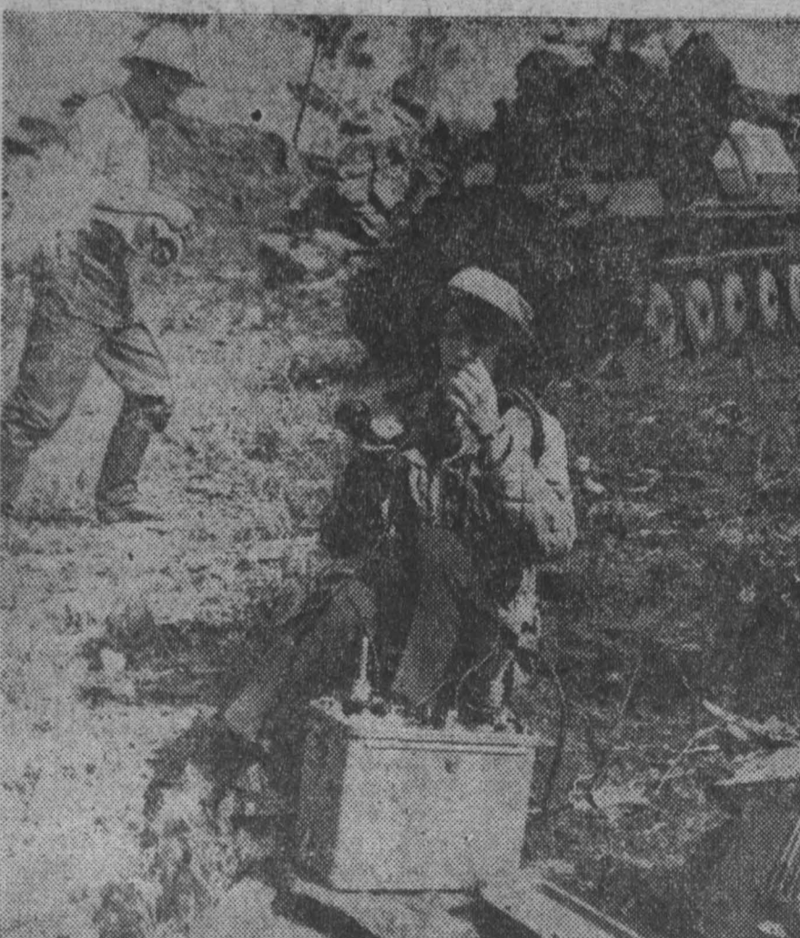
В дальней партии.