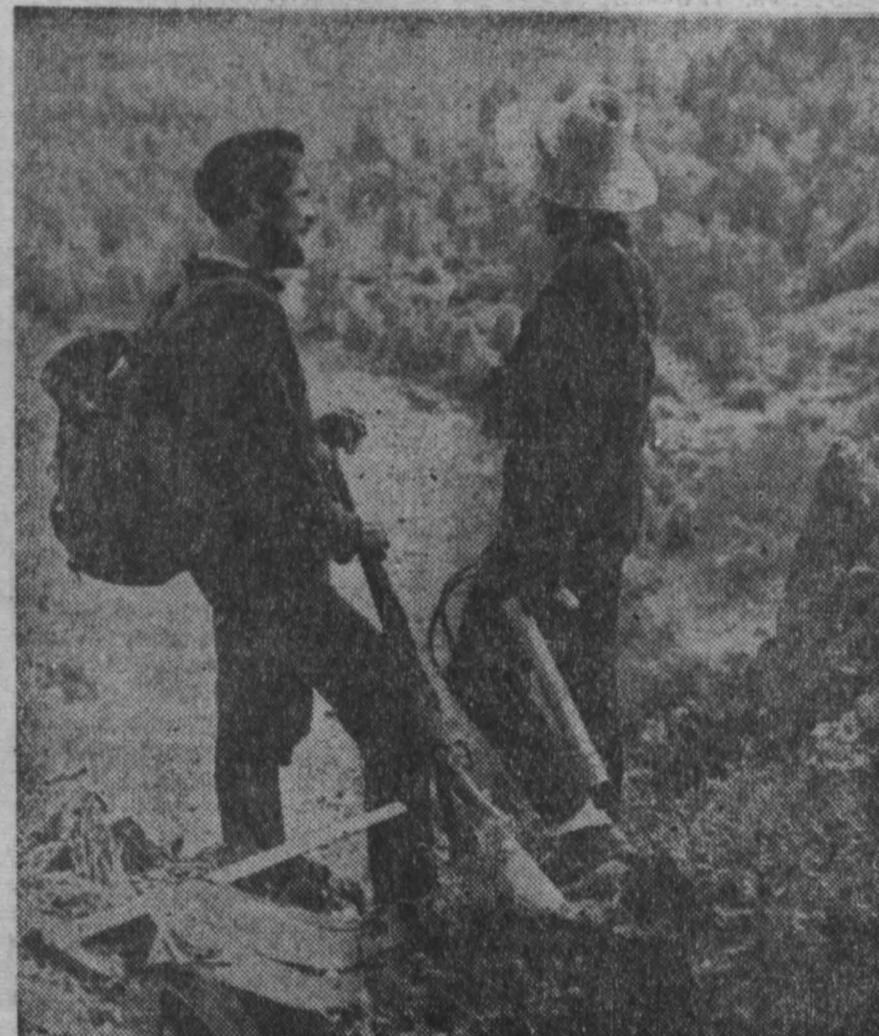
А путь их баек и долгов...