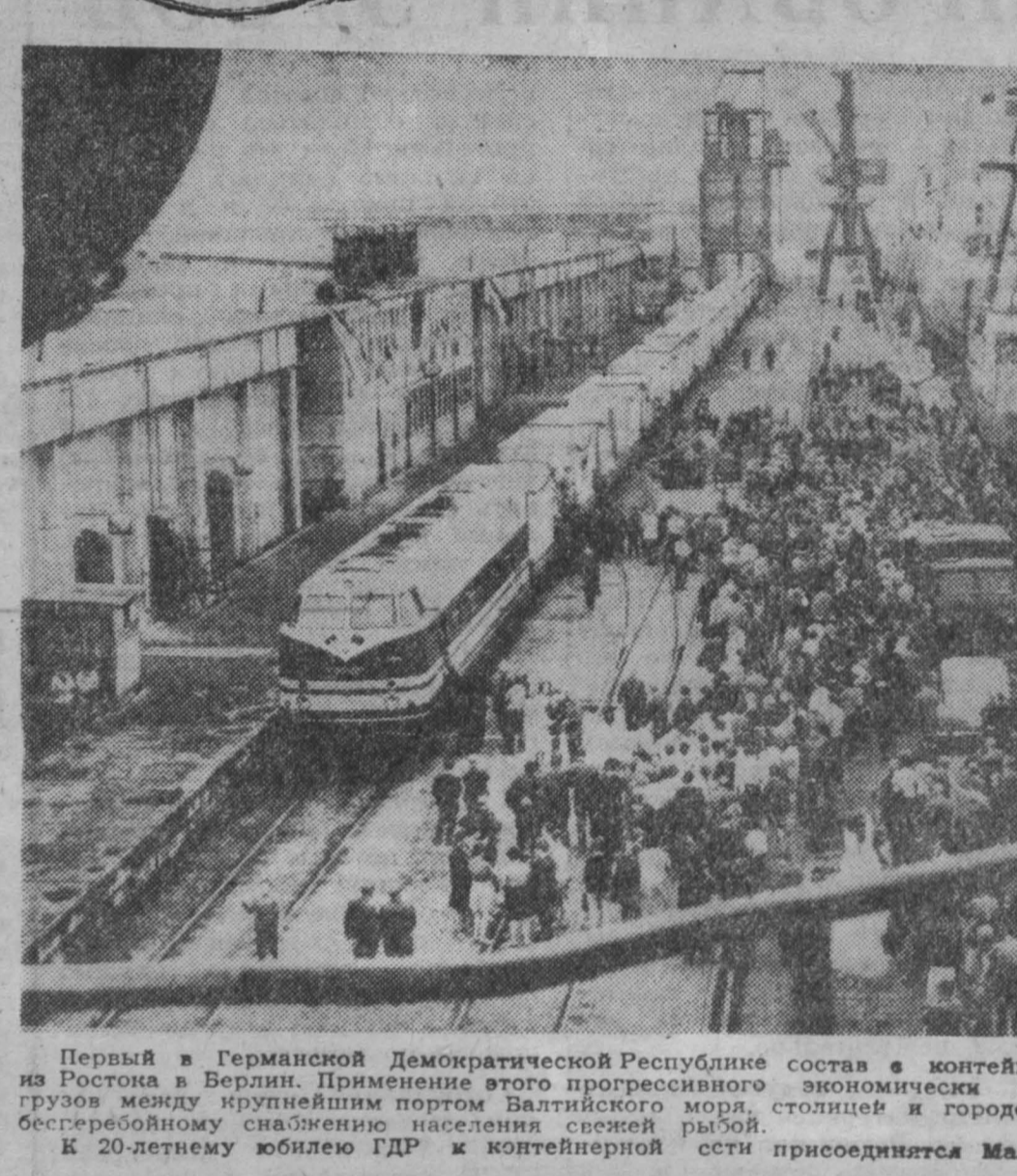
Первый в Германской Демократической Республике состав в контейнерах-рефрижераторах отправился на Ростоки в Берлин. Применение этого прогрессивного экономичного метода транспортировки грузов между крупнейшим портом Балтийского моря — столицей и городом Дрезденом будет способствовать бесперебойному снабжению населения свежей рыбой.