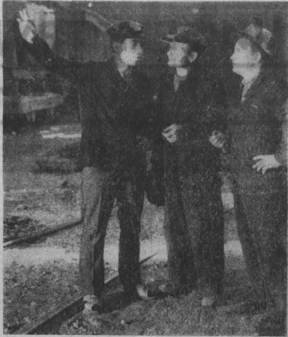
22 ноября этого года исполняется 40 лет. Как коллектив Магнитогорского металлургического комбината соревнуется с коллективом Кузнецкого металлургического...

Существующая сейчас городская телефонная станция имеет 1.500 номеров.