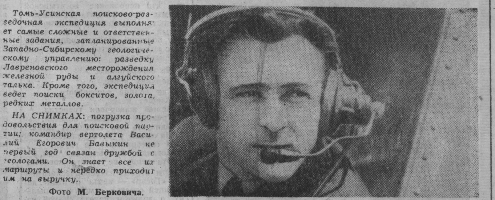
Томь-Усинская поисково-разведочная экспедиция выполняет самые сложные и ответственные задания, запланированные Западно-Сибирскому геологическому управлению: разведку Лавериевского месторождения железной руды и алмазного талька. Кроме того, экспедиция ведет поиски бокситов, золота, редких металлов.

23 июля 1969 года в Варшаве состоялась дружеская встреча между партийными и государственными руководителями Советского Союза и Чехословацкой Социалистической Республики, принимавшими участие в праздновании 25-летия народной Польши. Во встрече приняли участие Генеральный секретарь ЦК КПСС тов. Л. И. Брежнев, Председатель Президиума Верховного Совета СССР тов. Н. В. Подгорный, Президент ЧССР тов. Л. Саботка и Первый секретарь ЦК КПЧ тов. Г. Гусак. Участники встреч обменялись мнениями по актуальным вопросам дальнейшего развития дружественных отношений между КПСС и КПЧ, Советским Союзом и Чехословацкой Социалистической Республикой. Беседа советских и чехословацких руководителей прошла в духе сердечности и братской дружбы.