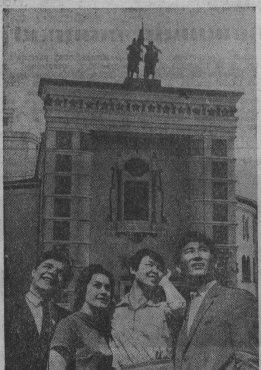
Группа выпускников Восточно-Сибирского института культуры перед зданием Бурятского театра оперы и балета.

«Признать необходимым... проведение в жизнь автономии, в соответствующих конкретных условиях форм... в первую голову для калмыков и бурят-монголов»