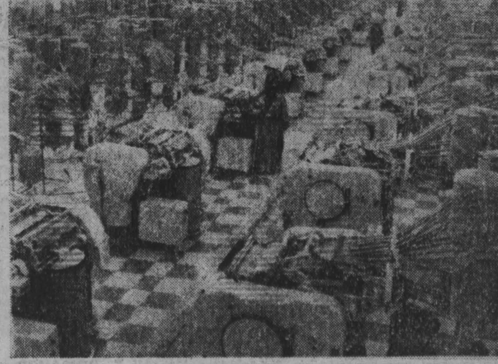
Тюменский камвольно-суконый комбинат — одно из крупнейших и самых мощных текстильных предприятий Сибири. Комбинат стрится и уже выпускает продукцию. К июлю года в цехах первой очереди будет выработано и отправлено трикотажным фабрикам страны около 3 тысяч тонн высококачественной полушерстяной и шерстяной пряжи.

Юно райкома КПСС одобрил эту инициативу и рекомендовал повсеместно в районе обобщить почин коллектива животноводов совхоза «Мазуровский», развернуть широкое соревнование за максимальное производство животноводческой продукции в пастбищный период.