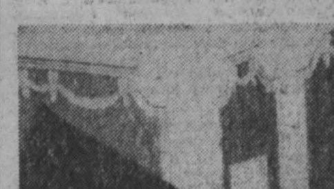
В эскадронной столице городе Кито открылась фотовыставка, посвященная 100-летию со дня рождения В. И. Ленина. Она организована Коммунистической партией Эквадора. Около 60 фотографий знакомят посетителей с основными этапами жизни и деятельности вождя международного рабочего движения.

ГУАЯНЬЛИ, 15 июля. (ТАСС). Участники проходившего здесь пленума ЦК Коммунистической партии Эквадора единодушно одобрили документы, принятые на международном Совещании коммунистических и рабочих партий в Москве.