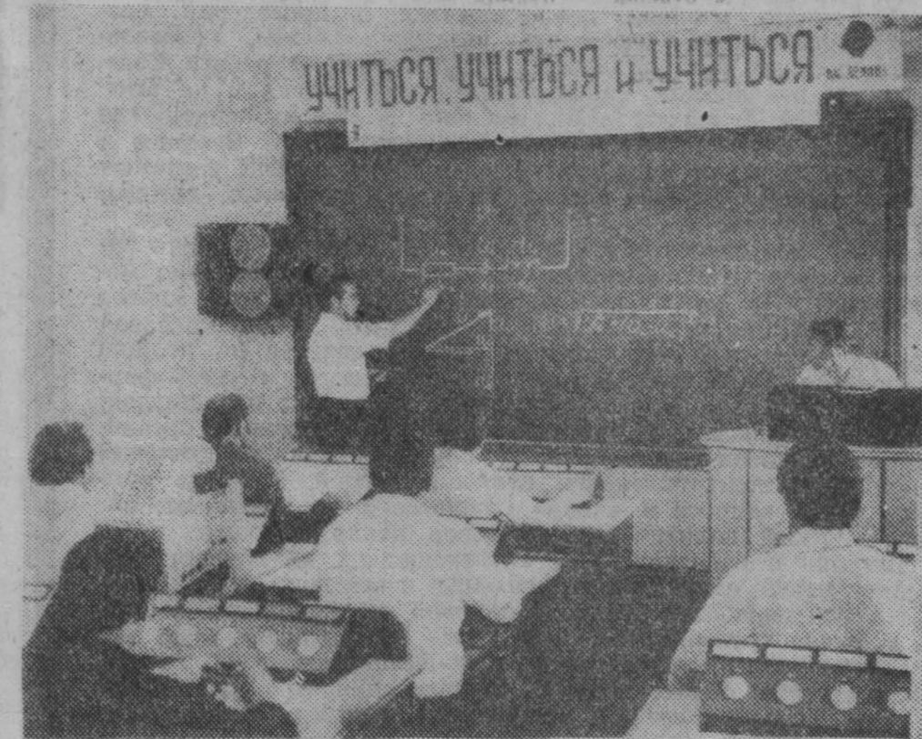
Кемеровскому горному техникуму в этом году исполнилось 40 лет. За это время здесь было подготовлено более пяти тысяч специалистов для шахт Кузбасса.