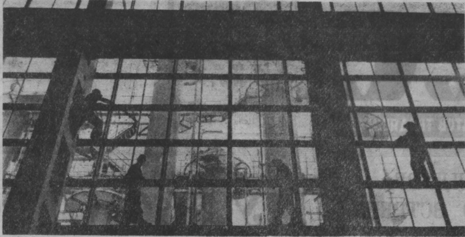
ВОЛОГОДСКАЯ ОБЛАСТЬ. Полным ходом идет монтаж технологического оборудования на строительстве Череповецкого азотного завода.

Сто студентов-заочников филологического факультета выжили на госэкзаменах. Впервые институт выпускает так много преподавателей русского языка и литературы.