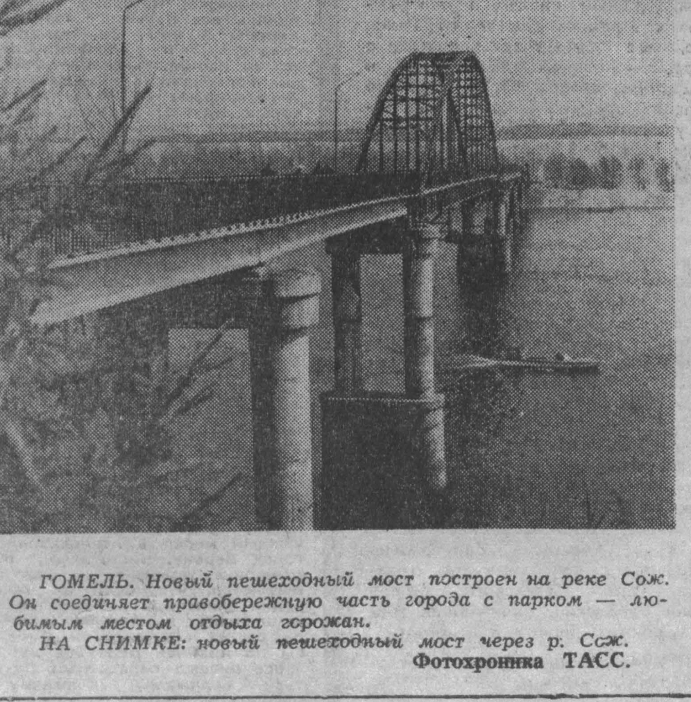
ГОМЕЛЬ. Новый пешеходный мост построен на реке Сож. Он соединяет правобережную часть города с парком — любимым местом отдыха горожан. НА СНИМКЕ: новый пешеходный мост через р. Сож.