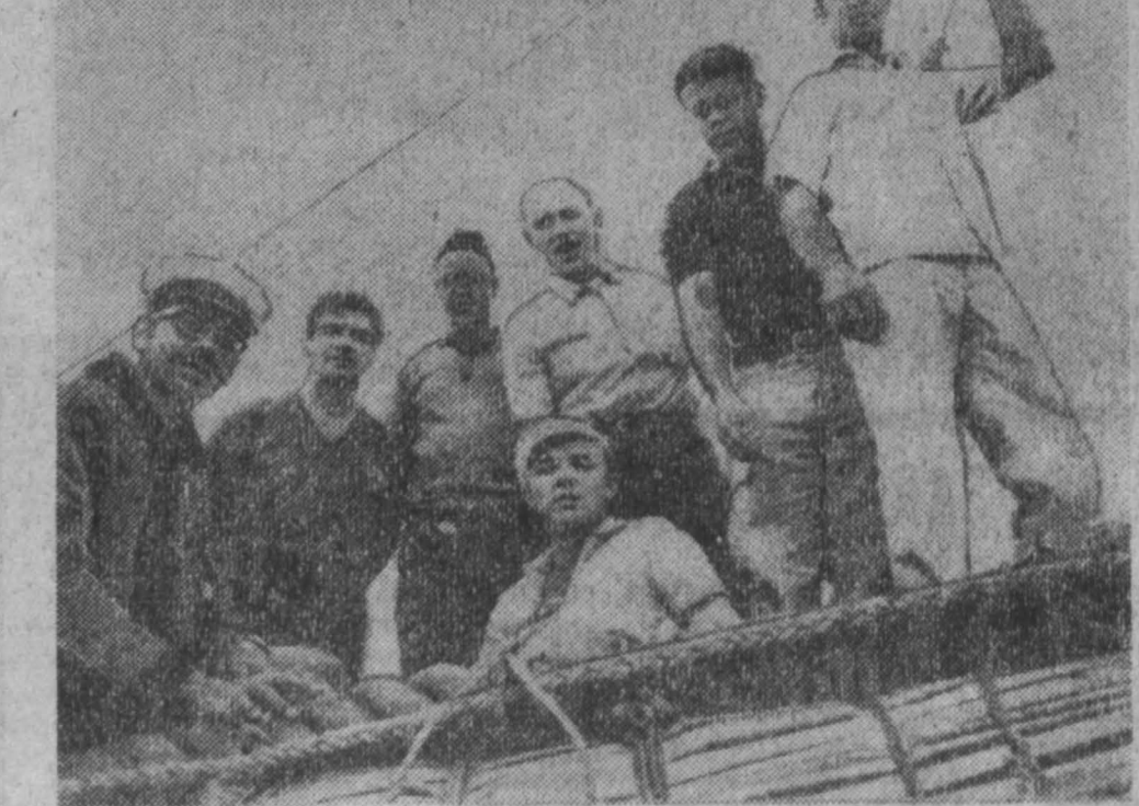
На снимке, взятом из шведской газеты «Дагенс нюхетер», — команда папирусного судна «Ра» перед отплытием из порта Сафи.

Артиллерия египетских вооруженных сил, сообщает корреспондент газет «Аль-Ахрам» из Суэца, сорвали все попытки израильтян доставить оружие и боеприпасы на передовые позиции через горный проход Метла.