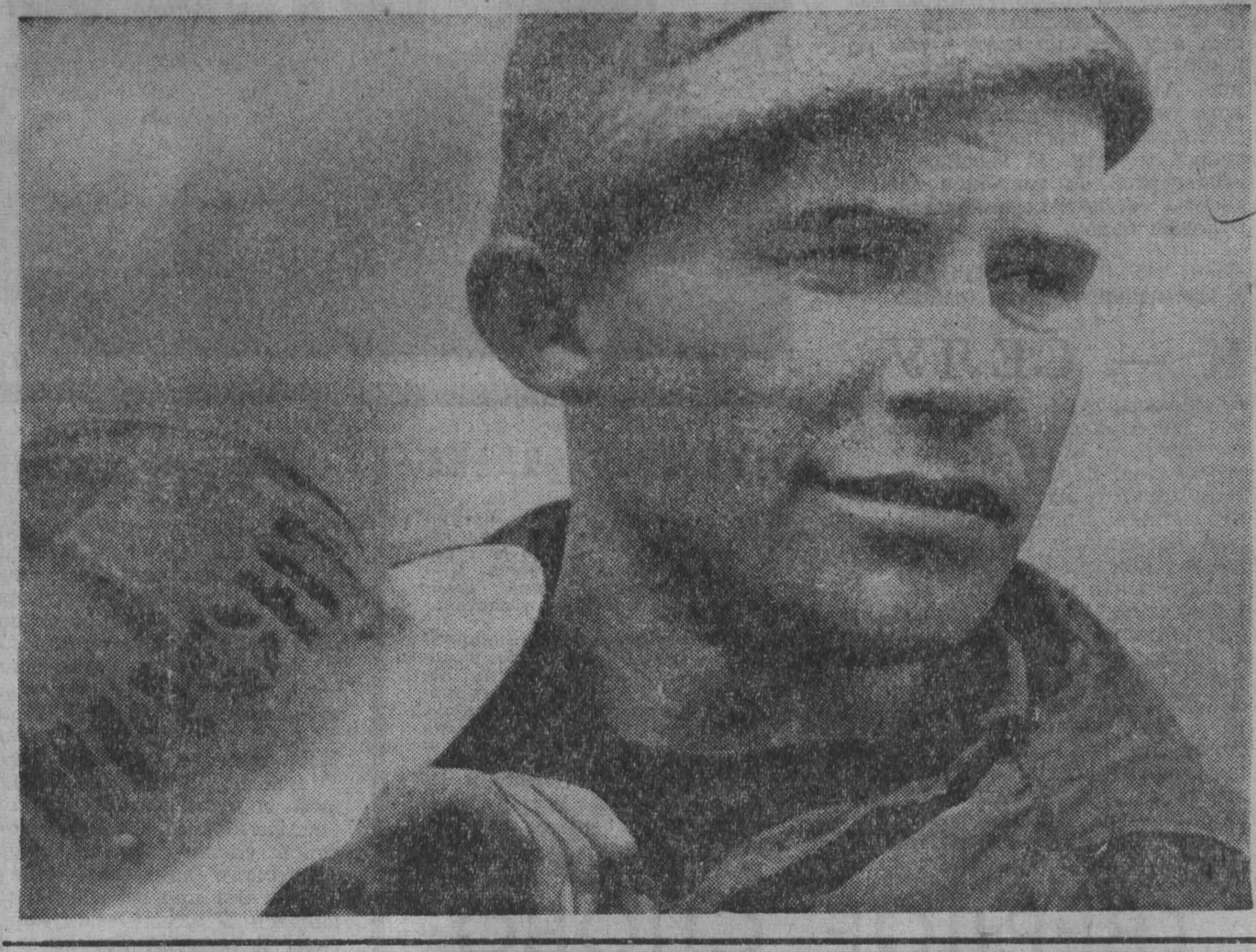
ВСЕСОЮЗНАЯ ШКОЛА МЕХАНИЗАТОРОВ

И все-таки, по нашему мнению, есть необходимость усилить эту сторону Устава путем некоторых изменений и дополнений ряда его положений. И вот в ходе разговора вокруг этих положений возникают довольно интересные предложения, вытекающие из анализа конкретных условий нашего колхоза. Дело касается в том, что в селе скоро будут в основном жить дома, близкие к городским. По селу пройдет много коммуникационных линий — водопровод, радио, телефон, электростанция. В этой связи возникает мнение, что присущие сельскому хозяйству работы должны выполняться в меньших, чем сейчас. Это важно для того, чтобы площадь колхозного поля была как можно меньше. Тогда меньше потребуются и затраты на все коммуникации, особенно на водопровод, канализацию и электростанцию. Могут сказать, что колхоз пока не в состоянии обеспечить потреб-