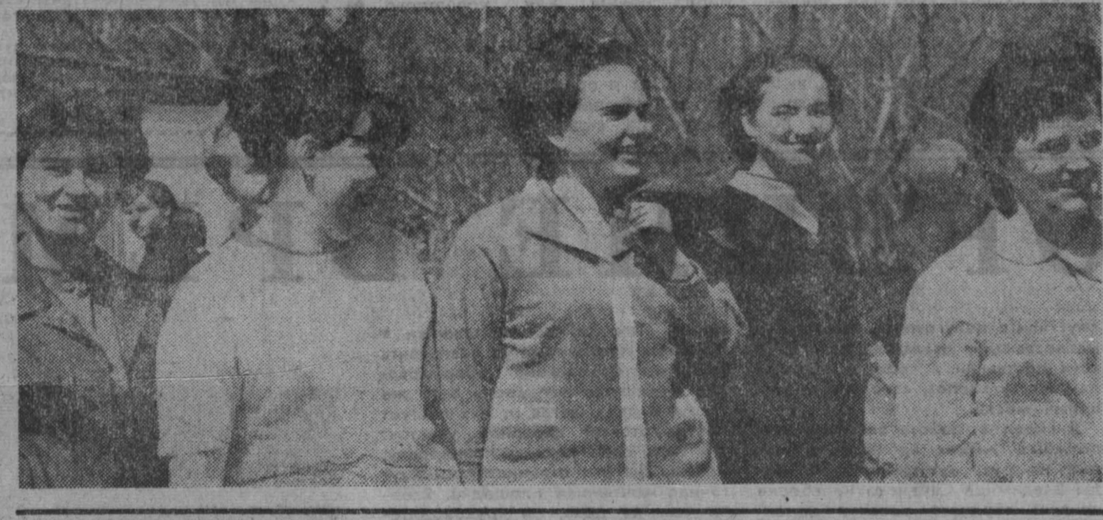
Напряженные у студентов дни — экзамены. Тысячи студентов проталкивают преподаватели свои зачетки и через несколько минут узнают, сколько баллов «стоят» их знания.

У выпускников Кемеровского медицинского института начались государственные экзамены. Шесть лет готовились будущие врачи к этому моменту. Они принесли свои, в общей сложности все около двух лет слушали свои лекции, а остальные время провели в клиниках, больницах, амбулаториях. Делали первые операции, ставили диагнозы. Каждое лето уезжали на практику в районные больницы.