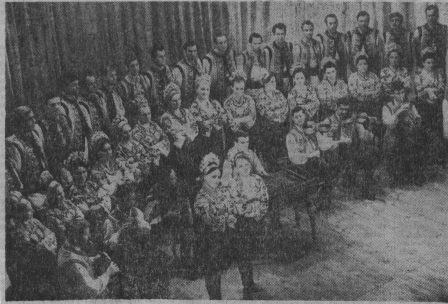
Буковинский ансамбль песни и танца Черновицкой областной филармонии в числе других творческих коллективов республики будет участвовать в декаде украинской литературы и искусства в РСФСР, которая открылась 27 мая 1969 года в Москве. Поездка в столицу совпадает с празднованием двадцатилетия ансамбля. За эти годы коллектив дал около четырех тысяч концертов в разных уголках нашей Родины. И в Кремлевском Дворце съездов, и в карпатских селах зрители с одинаковым воодушевлением устраивали исполнителям бурные овации. НА СНИМКЕ: выступает Буковинский ансамбль песни и танца.