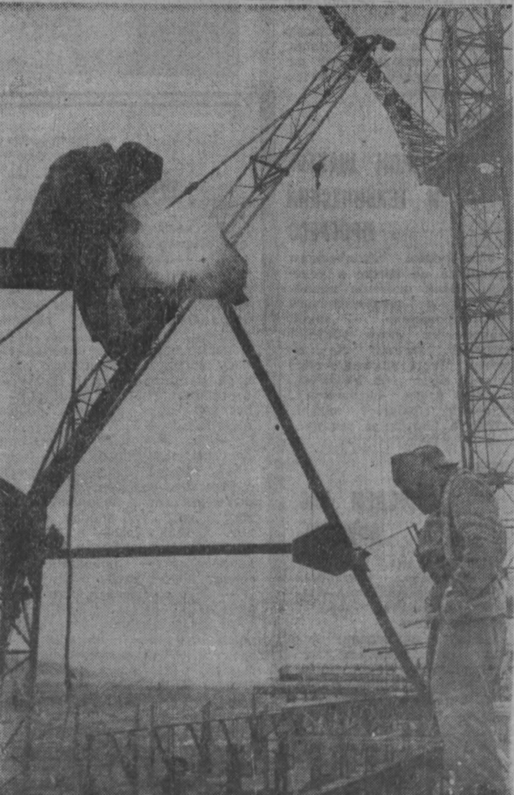
НА СНИМКЕ: на одном из участков строительства блюминга «1300».