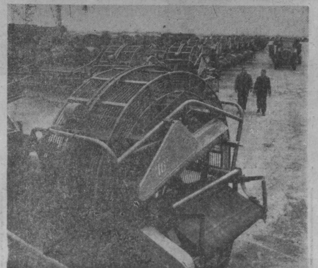
«Дружба» — так называется картофелеуборочный комбайн «ККУ-2», который выпускает Рязанский комбайновый завод.

Машина отделяет клубни от почвы, ботвы и подает их в бункер, откуда картофель погружается на транспорт.