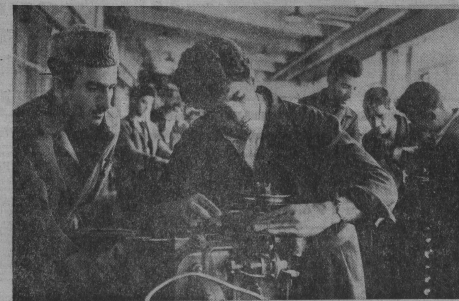
АФГАНИСТАН. В одном из домов Джамсалакского авторемонтного завода — терзача абганской автомобильной промышленности, построенного с помощью Советского Союза.

РИМ, 26 мая. (ТАСС). Сегодня в Италии по призыву трех крупнейших профсоюзных объединений — ВИК, Итальянской конфедерации профсоюзов трудящихся и Итальянского союза труда — началась общенациональная забастовка работников радио и телевидения.