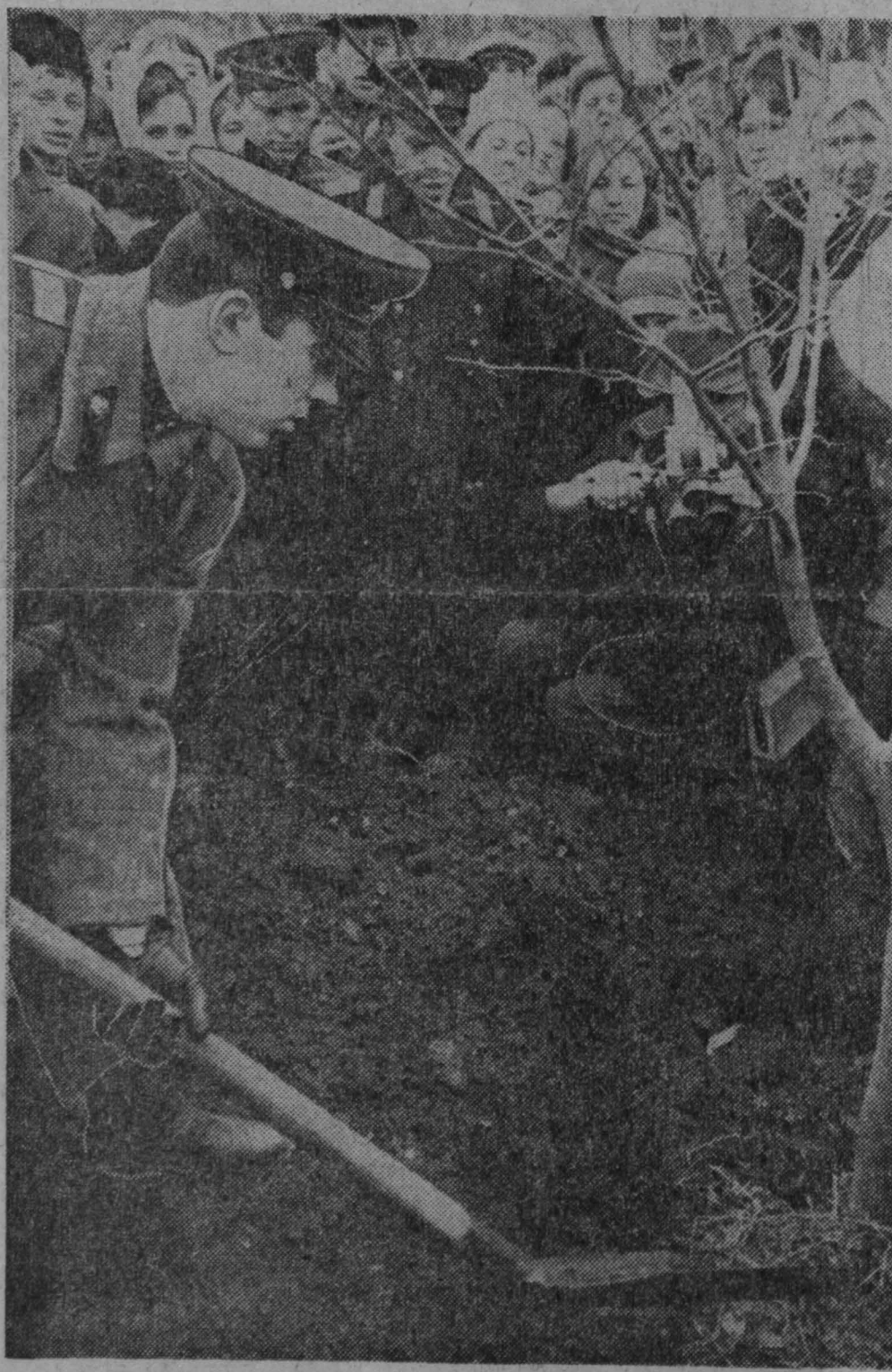
Герой Советского Союза Юрий Бабанский высаживает дерево в Аллее героев города Кемерово.