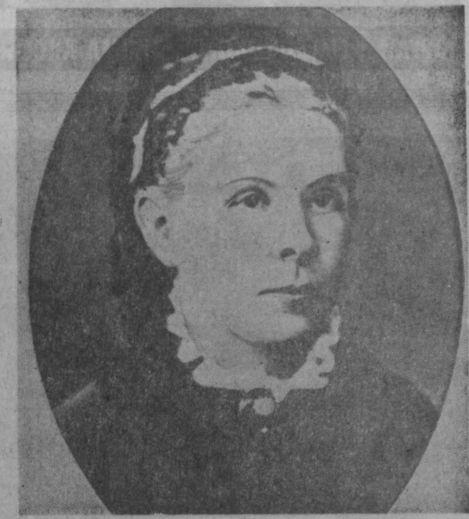
Мать Владимира Ильича Ленина Мария Александровна Ульянова (1835—1916).