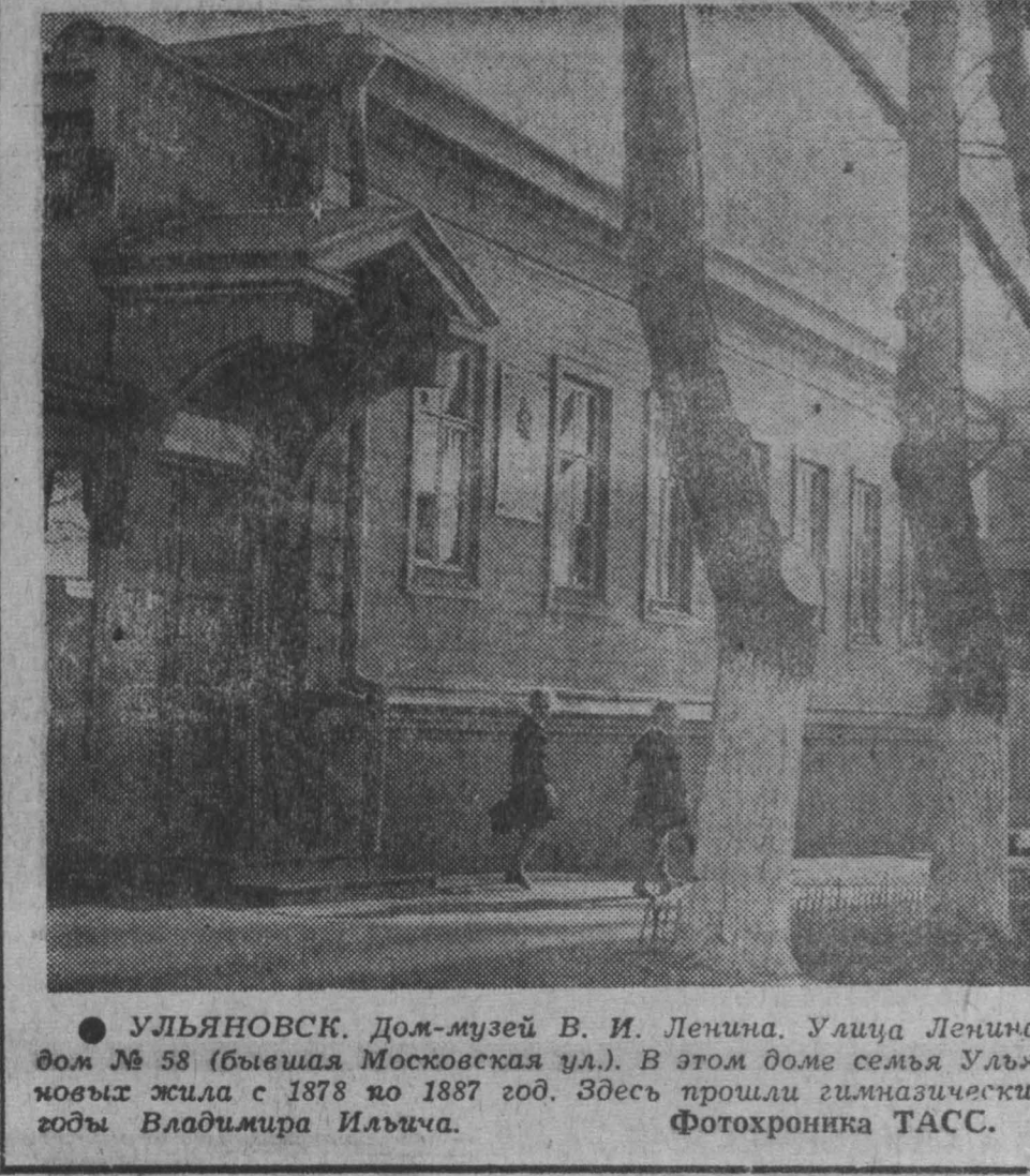
Ульяновск. Дом-музей В. И. Ленина. Улица Ленина, дом № 58 (бывшая Московская ул.). В этом доме семья Ульяновых жила с 1878 по 1887 год. Здесь прошли гимназические годы Владимира Ильича.