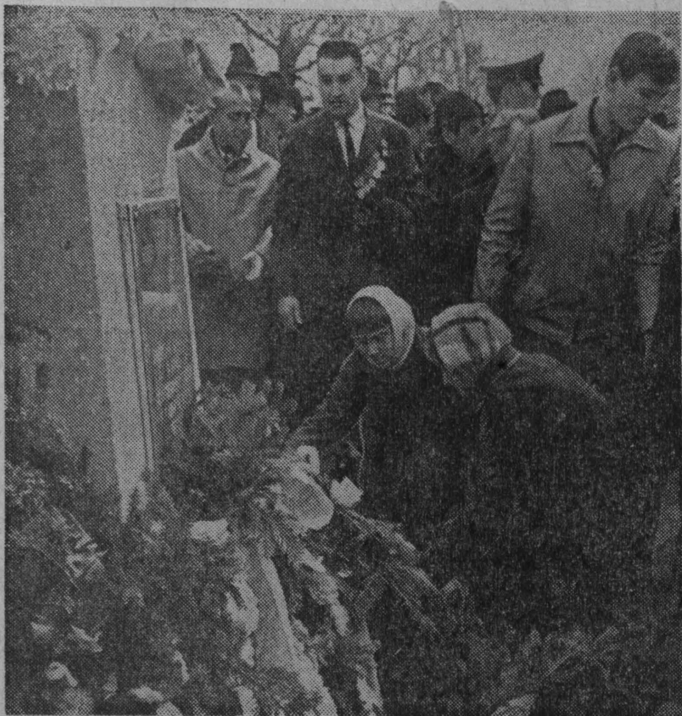
Возложение венков у обелиска погибшим воинам в Великой Отечественной войне в день 24-й годовщины со дня освобождения нашей Родины от фашистских захватчиков.