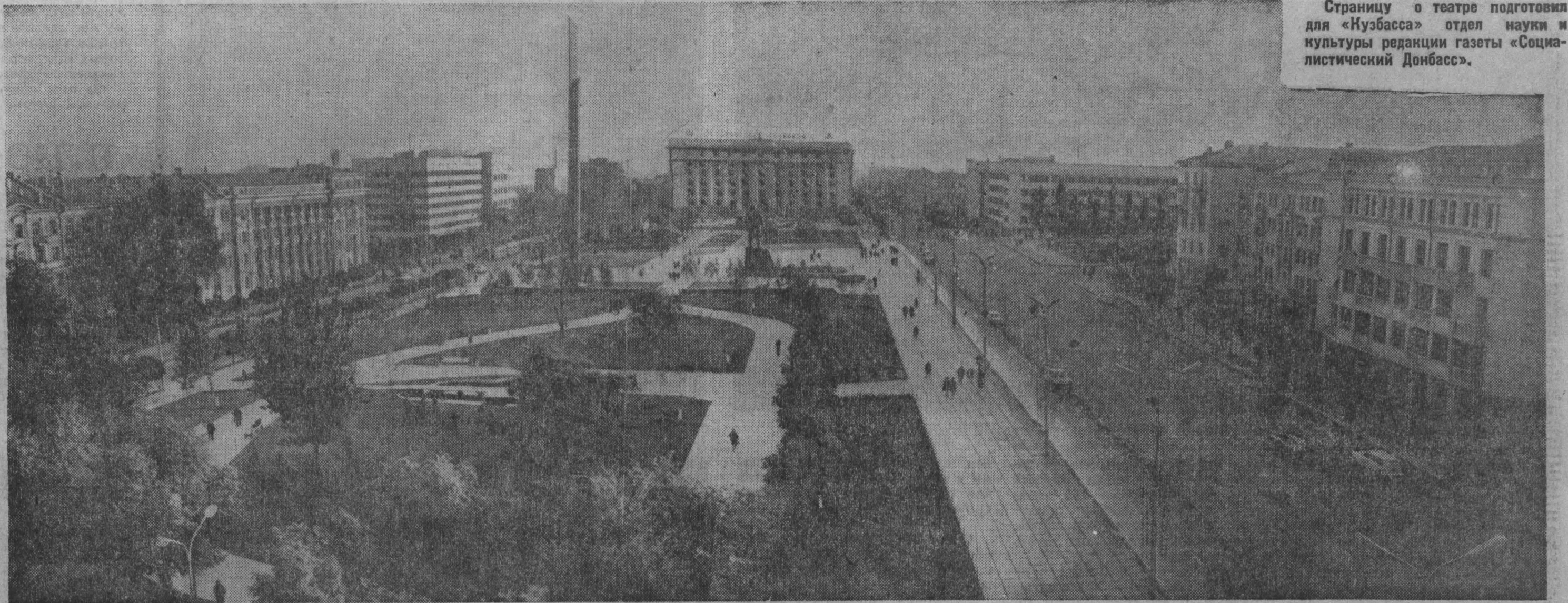
С каждым годом хорошеет Донецк. На снимке: площадь имени Ленина.