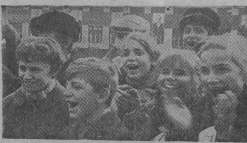
Лица этих болельщиков убедительно говорят: их команда впереди.