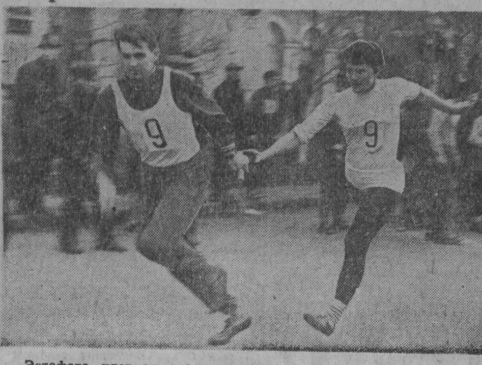
Эстафета идет от этапа к этапу.