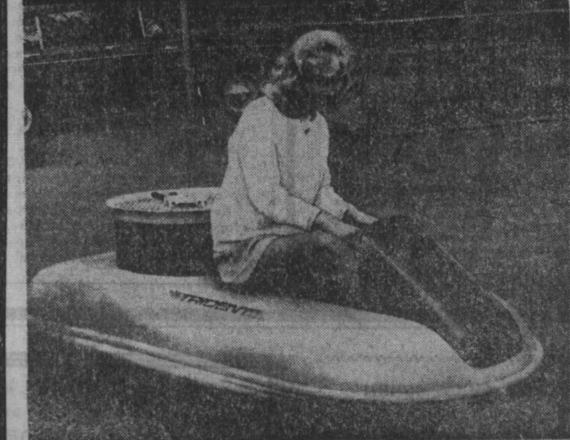
В Англии создана новая модель машины на воздушной подушке — «Трайдент». Машина, предназначенная для подростков, легка в управлении, надежна и может развивать скорость до 13 километров в час. Вес машины около 50 килограммов, длина — два метра. «Трайдент» расходует литр бензина за два часа работы.