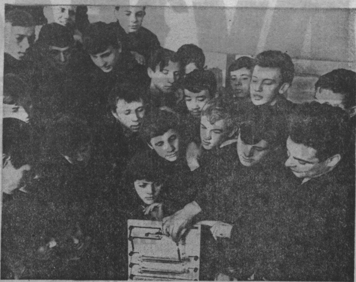
Новокузнецкое ГИТУ № 78 готовит кадры для треста «Кузнецкпроектстрой». Ежегодно десятки его воспитанников вливаются в многочисленную армию строителей.