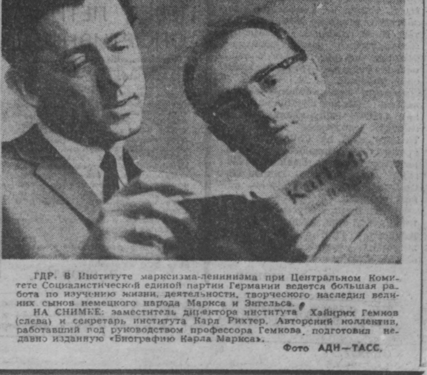
ГДР. В Институте марксизма-ленинизма при Центральном Комитете Социалистической единой партии Германии ведется большая работа по изучению жизни, деятельности, творческого наследия великого сына немецкого народа Маркса и Энгельса.

Это десятый по счету ядерный взрыв под землей в выщелоченной горах Невада произведено очередное подземное ядерное испытание.