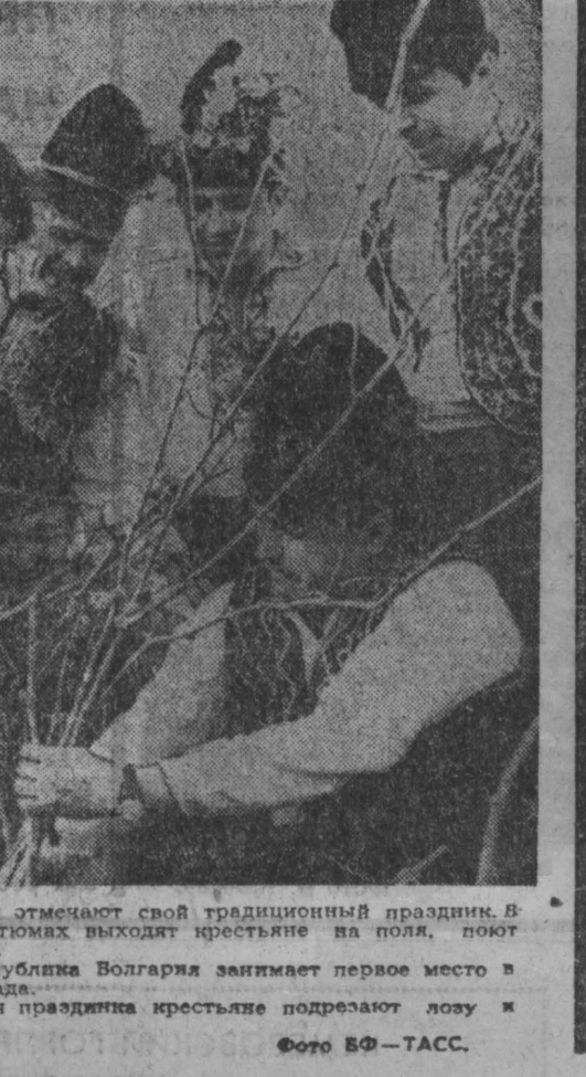
Виноградари Болгарии отмечают свой традиционный праздник. В ярдах национальных костюмов выходят женщины на поля, поют маршевые песни, танцуют.

Военные действия в Южном Вьетнаме ПАРИЖ, 16 апреля. (ТАСС). В пригороде Сайгона прибывший нацие завладел опорной базой между бойцами Народных вооруженных сил освобождения и американско-саigonскими войсками. Как отмечает сайгонский корреспондент агентства Франс Пресс, уже второй день патриоты ведут боевые действия в непосредственной близости от коммунистической столицы. Внезапной атаке были подвержены позиции 5-й дивизии маринеточных войск, дислоцированной в 27 километрах к северу-западу от Сайгона. В провинциях Куангбэй и Биньдинь, в 450 километрах к северу-востоку от Сайгона, несколько батальонов американской 173-й воздушно-десантной бригады проводили безуспешную операцию по освобождению местности. Несколькими контратаками бойцы НВСО сорвали наступление кералей. В дельте реки Меконг, в 80 километрах к югу-западу от Сайгона, подразделение НВСО успешно обстреляло несколько американских десантных судов. Одно из них было потоплено в результате прямого попадания.