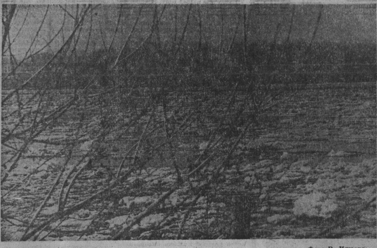
ЛЕДОХОД НА ТОМИ.

СЧАСТЛИВАЯ ПЯТИМИНУТКА В первом туре футболисты шахабского «Строителя» и кемеровского «Кузбасса» проиграли своим соперникам. И вот эти команды встретились между собой. Борьба долгого времени не давала результатов. За пять минут до финального свистка на табло красовались нули. Оставшаяся пятиминутка оказалась счастливой для наших ребят.