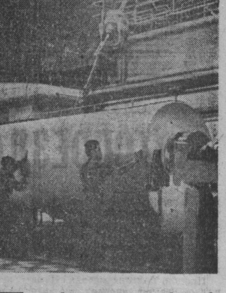
Фотокорреспондент ТАСС. Рабочие целлюлозно-бумажного комбината ржины в 1968 году дадут стране свыше 325 тысяч тонн бумаги, доведут скорость выработки бумажноделательных машин МБ 9 и 10 до 700—720 метров в минуту.

Фотокорреспондент ТАСС. Рабочие целлюлозно-бумажного комбината ржины в 1968 году дадут стране свыше 325 тысяч тонн бумаги, доведут скорость выработки бумажноделательных машин МБ 9 и 10 до 700—720 метров в минуту. На СНИИКЕ у наката 9-й бумажной бумажноделательной машины. Фотокорреспондент ТАСС.