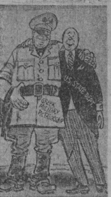
— Волобуновили нормальные дипломатические отношения (надпись на фигуре: греческая военная диктатура, госдепартамент США).

Соединенные Штаты Америки, все больше превращающиеся в основную очаг нестабильности и реакции, легко находят общий язык с греческой военной хунтой, подавляющей свободу в своей стране. (Из газет).