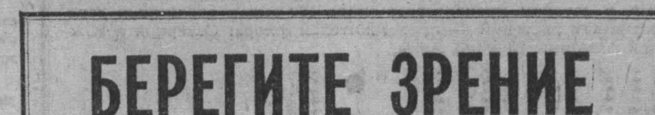
В журнале «Здоровье» была опубликована статья кандидата медицинских наук Веры Белой «Берегите зрение». Агентство печати Новости с разрешения редакции журнала предлагает ее с небольшими сокращениями вниманию читателей.

Хорошо это или плохо, когда люди читают в автобусах, трамваях, троллейбусах, автомашинах? Жажда знаний похвальна и понятна. Но чтение в движущемся транспорте может причинить вред глазам. В таком положении трудно сохранить наиболее благоприятное для зрения расстояние между глазами и книгой (30—35 сантиметром), к тому же далеко не всегда бывает хорошее освещение.