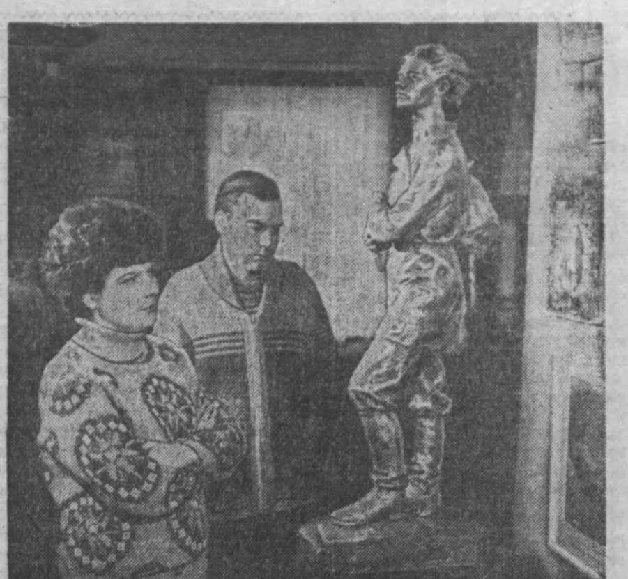
ТАТАРСКАЯ АССР. Здесь широко отмечается столетие со дня рождения А. М. Горького. Кавказцам особенно дорого имя писателя. В старинном волжском городе провел свои юные годы Алексей Пешков...