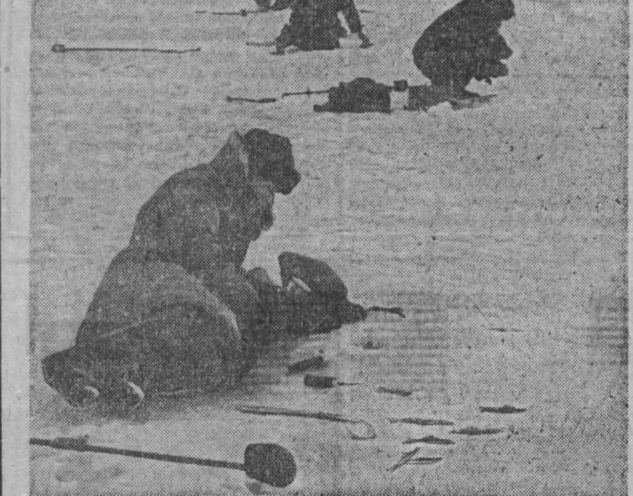
В прошедшее воскресенье погода выдалась, прямо скажем, не весенняя: облачно, сильный холодный ветер. Но это не остановило любителей подледного лова. Рыбаки девяти новосельских команд на Топи около деревни Курьяны демонстрировали свою спорность.