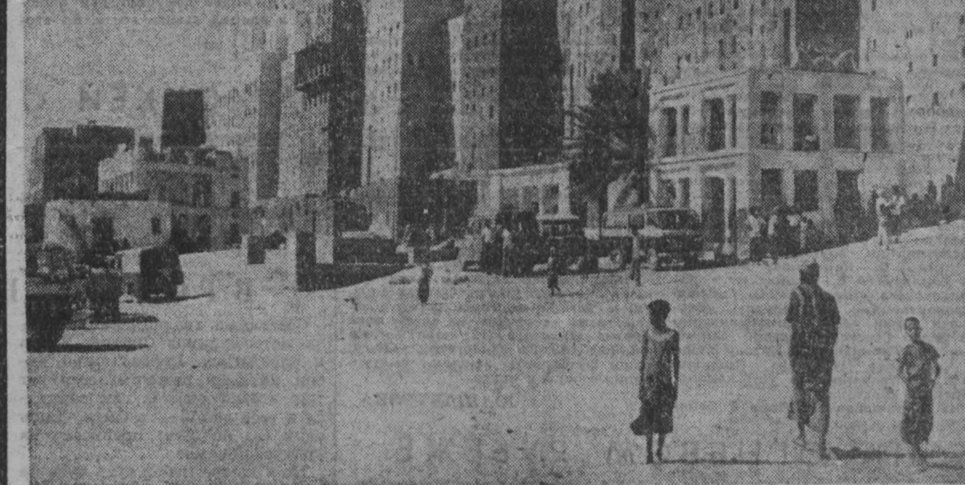
НАРОДНАЯ РЕСПУБЛИКА ЮЖНОГО ВЬЕМА. НА СНИМКЕ: «глинобитные небоскребы», построенные 300 лет назад в Шибале (губернаторство Хао-самуэт). Эти величественные сооружения, прославившие город на весь мир, говорят о талантливости и мастерстве народа.

В последнее время, по сообще-ниям японской печати, Окинава все больше превращается в воен-ный арсенал и передовую базу американской агрессии во Вьет-наме. 5 февраля на базу Кадама были переброшены 20 стратегиче-ских бомбардировщиков «В-52», которые ежедневно совершают вы-леты в неизменном направлении.