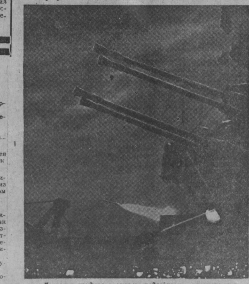
Дважды и трудная песня за подвобным «противником» закончилась успешно, корабль точно смелся в атаку.