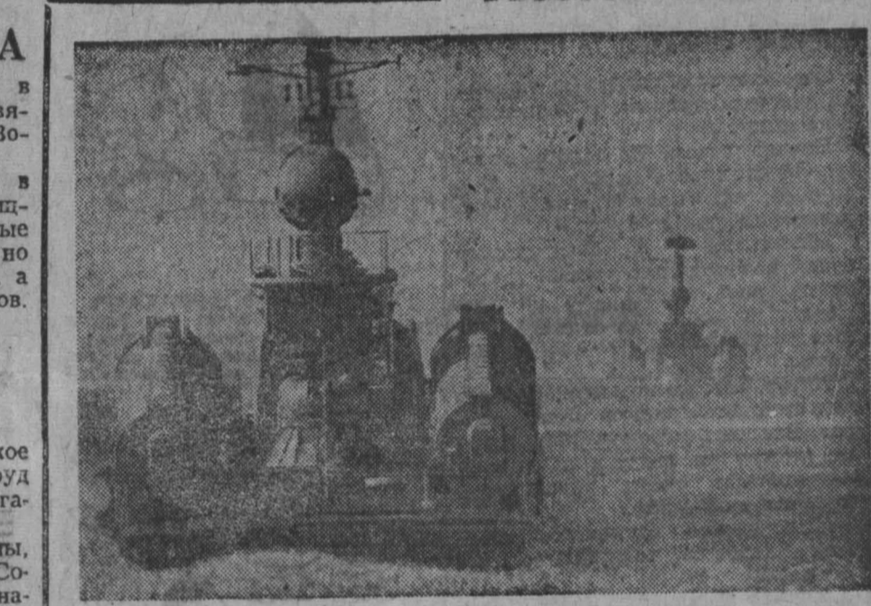
Ракетные катера в походе.