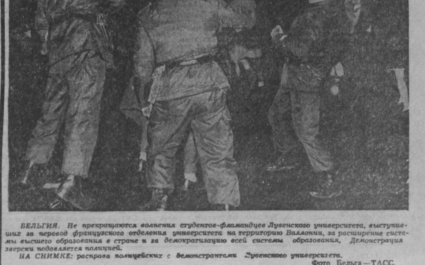
БЕЛЬГИЯ. Не прекращаются волнения студентов-фламандцев Лувенского университета, выступивших за первой французского отделения университета на территории Валлонии, за расширение системы высшего образования в стране и за демократизацию всей системы образования. Демонстрация зверски подавляется полицией. НА СНИМКЕ: росправа волнелейских с демонстрантами Лувенского университета.

Пленум обсудил разработанную комиссией ЦК проект программы Коммунистической партии Германии, — сообщается в коммюнике. Центральный Комитет единогласно решил передать проект программы на обсуждение членов партии и общественности.