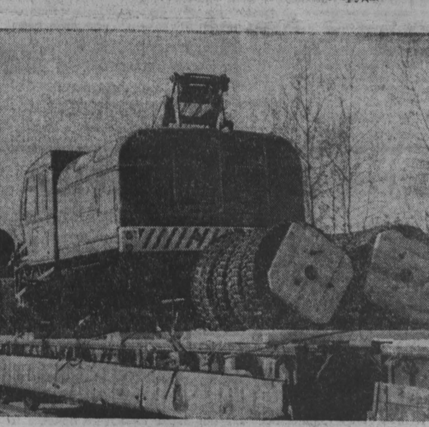
Самодвижные краны типа К-161 с маркой Юргинского машиностроительного завода можно встретить на многих строящихся объектах. Этот кран поднимает многометровые грузы на высоту до 25 метров.