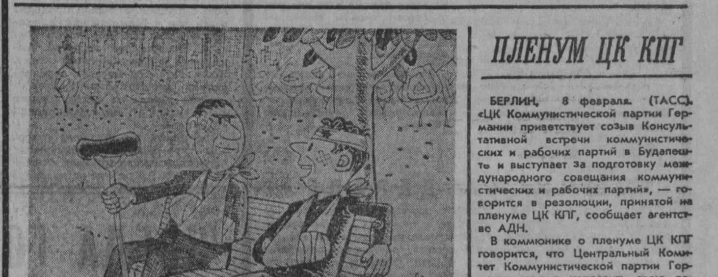
— Вы солдат, раненный во Вьетнаме. Или, как я, студент, участник в демонстрации протеста? Карикатура из найрской газеты «Аль-Ахрам».

Вьетнамские концентративные войска ударили народных вооруженных сил переиздали все дороги, ведущие в Сайгон, в том числе стратегические шоссе № 1, № 4 и № 15.