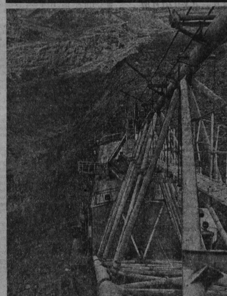
Четыре миллиарда тонн топлива — танковы запасы Харанорского месторождения бурого угля, самого крупного и перспективного в Забайкалье (Читинская область).

Сейчас здесь, в Даурской степи, сооружается открытый угольный карьер. К концу пятилетия Харанорский разрез достигнет проектной мощности — три миллиона тонн угля в год.