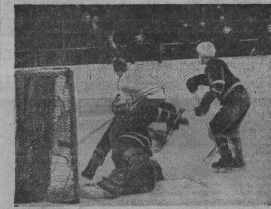
Повторная встреча «Водника» со «Стронтелем». Победили гости — 4:3. НА СНИМКЕ: момент встречи.

Пять дней в спортивном зале мединститута проходили отборочные соревнования по волейболу для команд медицинских вузов Уральского военного округа. Первое место в женской зоне. Первое место в мужской зоне. Первое место в женской зоне. Первое место в мужской зоне. Н. БУКОВЕВ.