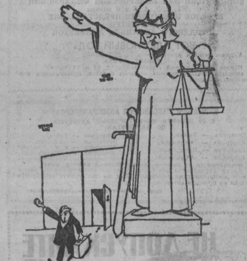
В ФРГ досрочно выпущен из тюрьмы палач Освенцима, всеобщего К. Нейберт, приговоренный всего лишь к трем с половиной годам лишения свободы.

тенная на легальном аукционе, не исчерпа с горизоном, и делают это зачастую успешнее полиции, которая иногда годами ищет пропавшие из каких-нибудь музеев или галерей.