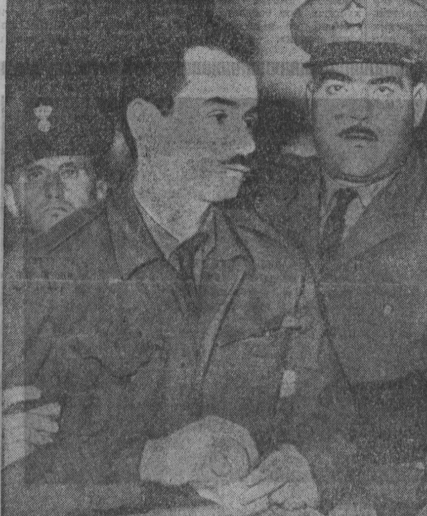
Александр Панатулис — греческий патриот и борец за демократию и независимость, приговоренный к смертной казни по обвинению в покушении на премьер-министра и в попытке свергнуть существующий режим.

СООБЩЕНИЕ МИНИСТЕРСТВА ВНЕШНИХ ДЕЛ ЧССР ПРАГА, 24 декабря. (ТАСС). Агентство ЧТК сообщает, что по решению министерства внутренних дел ЧССР на днях из Чехословакии выслан Аллан Тильер, гражданин Великобритании.