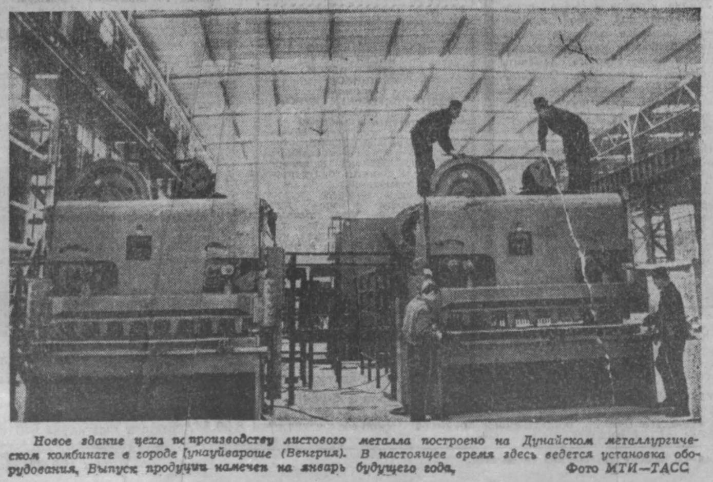
Новое здание цеха по производству листового металла построено на Дунайском металлургическом комбинате в городе Гунтауварше (Венгрия). В настоящее время здесь ведется установка оборудования. Выпуск продукции начнется на январь будущего года.

Выступающие подчеркивали историческое значение факта образования Национального фронта освобождения Южного Вьетнама, являющегося организацией и руководителем борьбы народа Южного и Северного Вьетнама в борьбе против агрессии США.