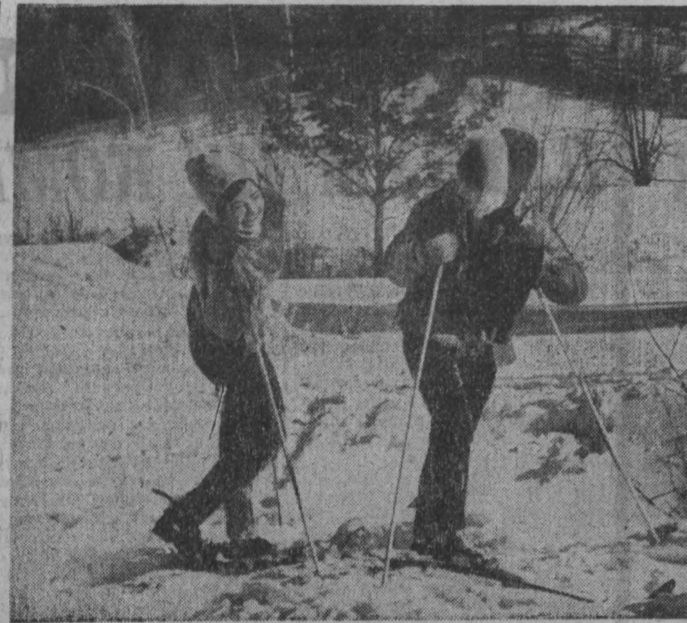
ПО ПЕРВОМУ СНЕГУ.