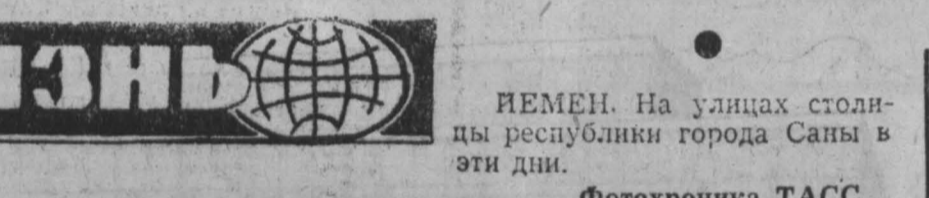
ИЕМЕН. На улицах столицы республики города Самы в эти дни.

Орден 15 лет заместители Размером этот награжденный знак не больше иголки и, как две капли воды, похож на французский орден «Святой Елены».