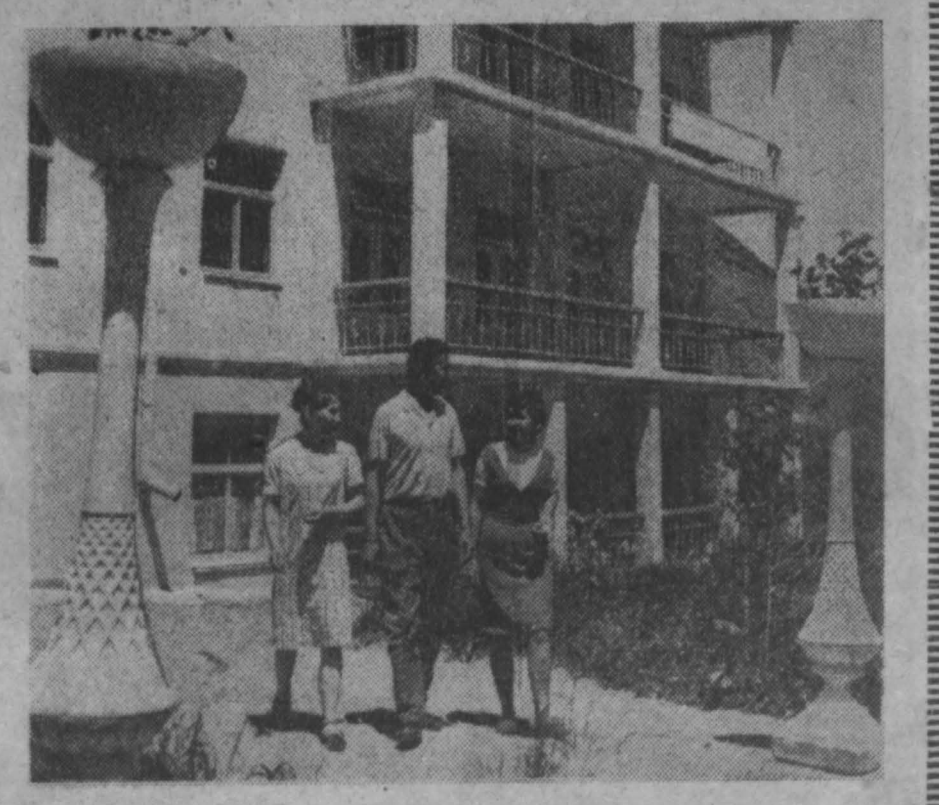
КИРГИЗСКАЯ ССР. В живописном ущелье Киргизского Ала-Тоо, где претекает бурная Иссык-Атнинка, в густой зелени горных долов высится корпус одного из старейших курортов республики. НА СНИМКЕ: новый корпус на курорте «Иссык-Ата».

БРАТСК. (Корр. ТАСС). Лесохимик Братска на днях отправили в Чехословакию 4.500 тонн кордовой целлюлозы, идущей на изготовление шп. Листы целлюлозы по заказу чехословацких друзей покрыты специальным активатором, улучшающим дальнейшую обработку целлюлозы на химических предприятиях. (ТАСС.)