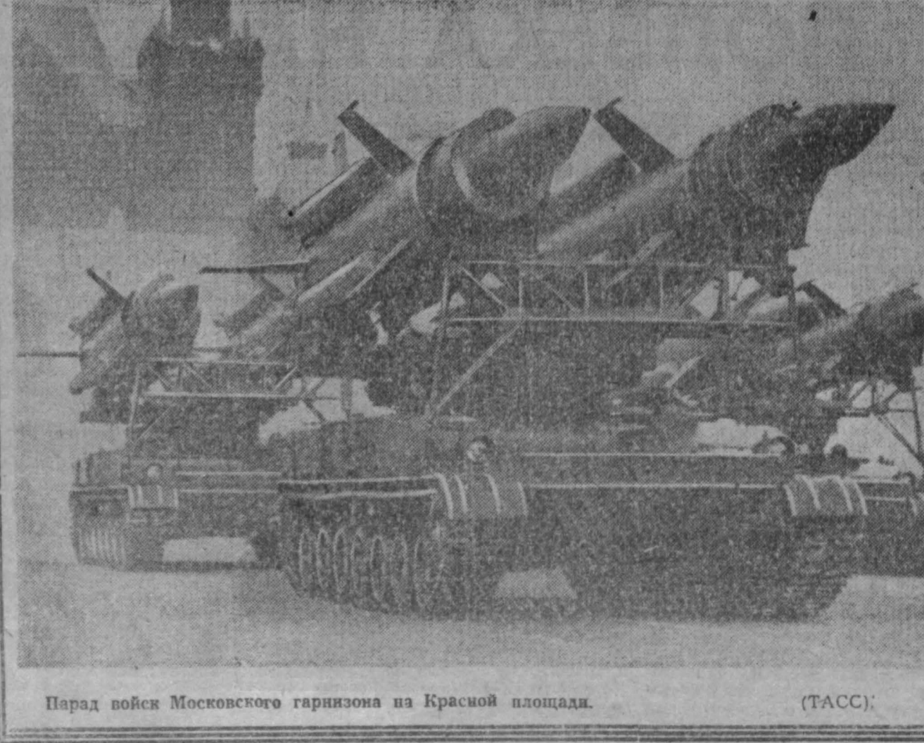
Парад войск Московского гарнизона на Красной площади.

В. МОИСЕЕВ. НА СНИМКАХ: праздничная демонстрация в областном центре.