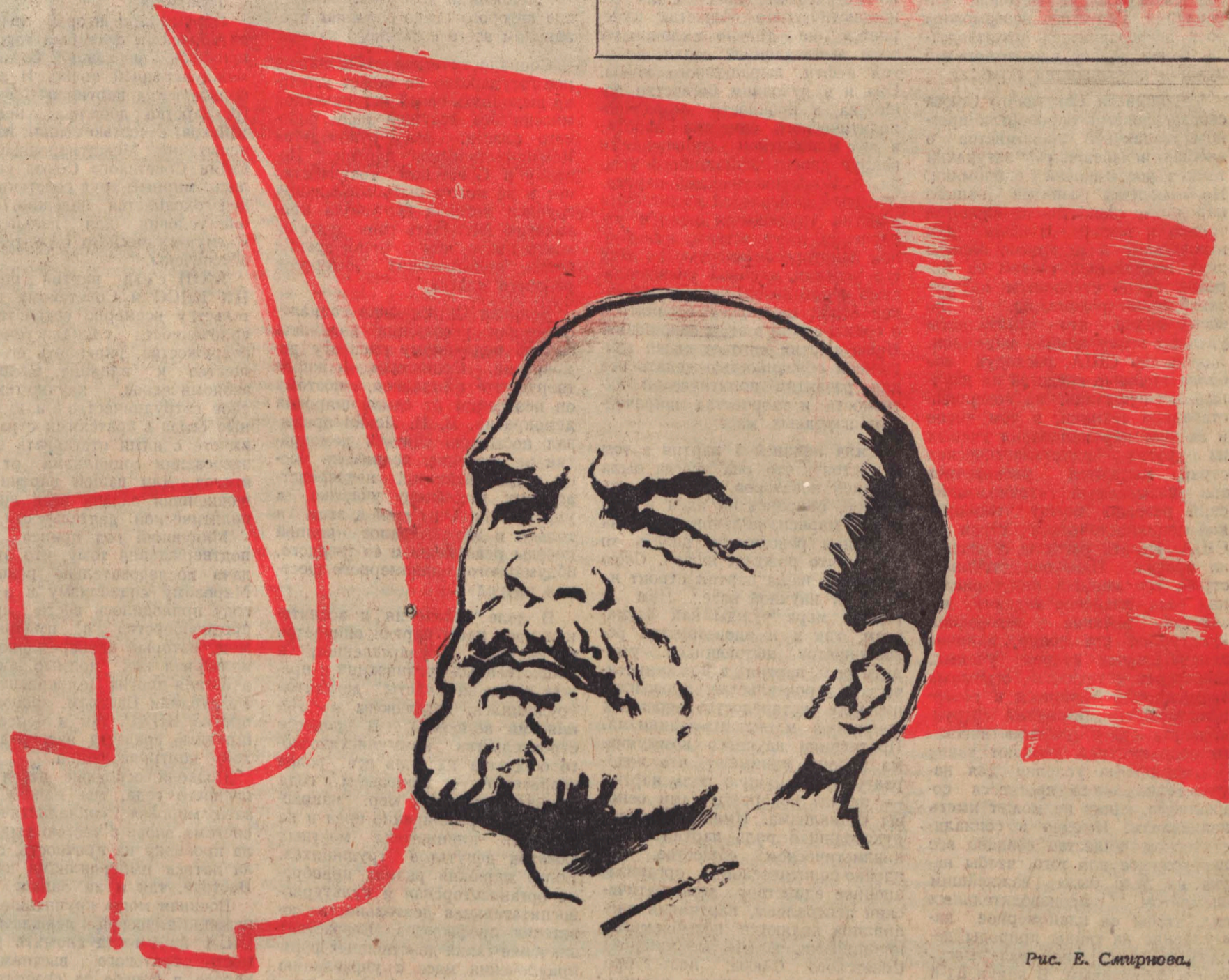
Рис. Е. Смирнова.

История не знает легких путей. Переход человечества от капитализма к социализму сопровождается коренной ломкой старых и рождением новых общественных отношений, провозглашающих в условиях непримиримой классовой борьбы в этой освободительной борьбе нового со старым стилем и приливы и временные отлив.