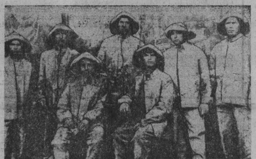
Одна из первых молодежных бригад шахты «Коксова-1» в Прокопьевске.

Каждый год вступали в строй сотни заводов и фабрик, которым нужен был уголь. На призыв партии — дать на-гора больше хлеба индустрии, комсомол бросил клич: «ИДИ В ЗАБОЙ ОВЛАДЕВАТЬ РЕШАЮЩИМИ УЧАСТКАМИ УГЛЕДОБЫЧИ». Комсомольские организации старейших рудников Кузбасса — Кемеровского, Анжерского, Ленинского, Прокопьевского почти всех юношей отправили в шахты, девчата работали в ламповых и на поверхности. Участники конференции молодых ударников Прокопьевска 12 июня 1930 года обращались к молодежи: «Дорогие товарищи! Только Советская власть и большевистский пятилетний план развития народного хозяйства позволили нашему Прокопьевскому руднику расти не по дням, а по часам. На богатых углях нашей местности многократно выросло производство угля, производительность которых достигла невиданных в мире размеров — от 2,5 до 7