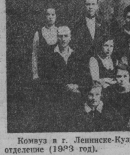
Комвуз в г. Ленинске-Кузнецком — комсомольское отделение (1933 год).

«Приходилось начинать с самого малого — с ликвидации неграмотности. В 1928 году ЦК ВЛКСМ объявил культпобор против неграмотности, пьянства, грязи. Тысячи комсомольцев стали культармейцами и оказали огромную помощь армиям народного образования и обществу «Долой неграмотность». «Щегловский горком ВЛКСМ поставил задачу: Обязать всех членов ВЛКСМ немедленно вступить в ряды культармейцев. Прикрепить к культурной работе и каждому неграмотному рабочему и работнице грамотных комсомольцев и обязать их немедленно приступить к обучению грамоте этих прилепленцев. Обязать секретарей ячеек делать между делом отчеты в комсомольских билетах о выполнении комсомольцами заданий по ликвидации неграмотности и ответственности не выполняющих эти задания. Вложить специальные листки в билеты для этой цели». «Плакаты, лозунги с призывами: