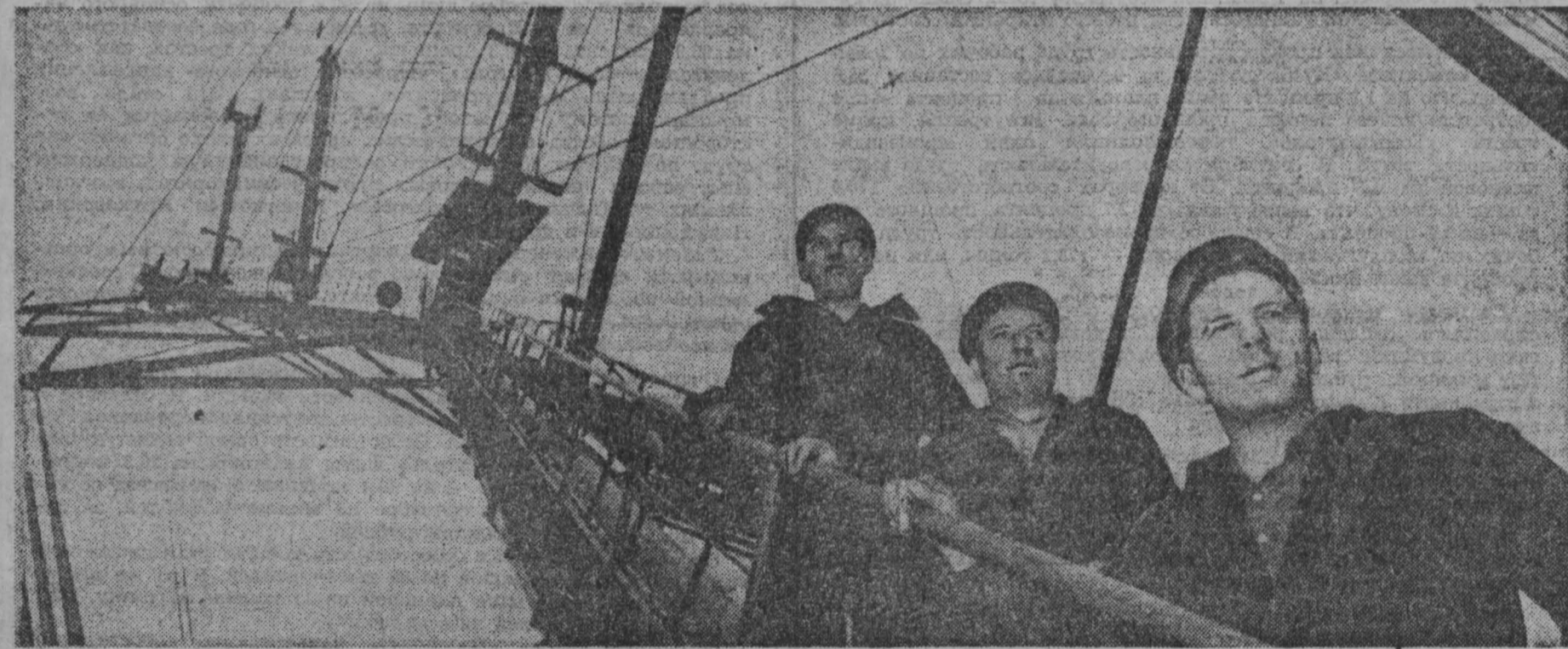
из последней почты