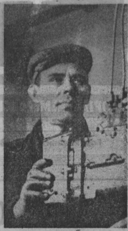
По-ударному трудятся в дни предгорных соревнований горняки угольного карьера Красновосток...