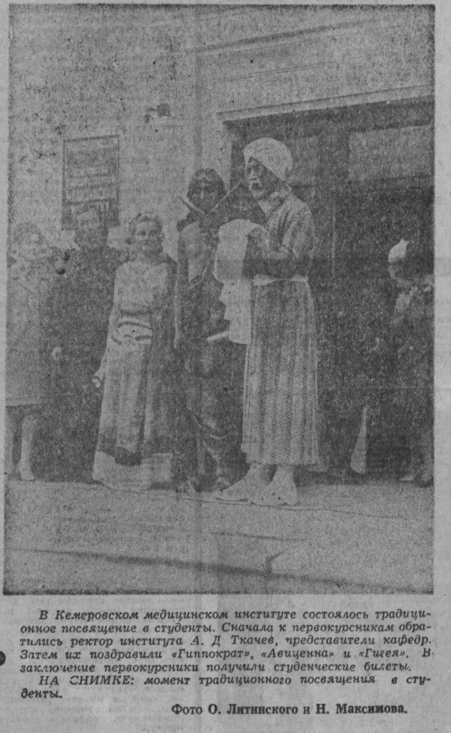
В Кемеровском медицинском институте состоялась традиционная посвящение в студенты.

КАКИХ только не существует в мире коллекций! Среди них и коллекция монет. Увлечение русскою историей монетологии — это увлечение многих любителей монет. Но собрать их не просто старинные монеты, а только русские монеты.