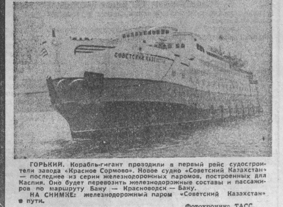
ГОРЬКИИ. Корабль-гигант провозили в первый рейс судостроительного завода «Красное Сормово». Новое судно «Советский Казахстан» последнее из серии железнодорожных паромов, построенных для Наспид. Оно будет перевозить железнодорожные составы и пассажиров по маршруту Вану — Красноармейск — Вану.