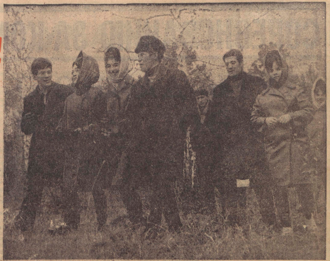
Юноши и девушки, которых вы видите на этом снимке, молодые труженики совхоза «Левинские» Юргинского района. Подробный рассказ об их жизни, труде и учебе читайте на третьей странице.

Год издания 47-й. № 242 (12524). Воскресенье, 13 октября 1968 года. Цена 2 коп.