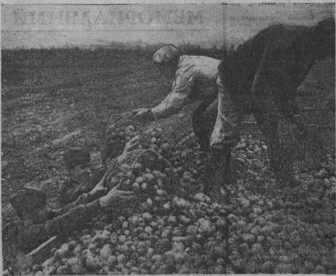
СССР. Советские воины помогают чешским крестьянам убрать урожай картофеля.