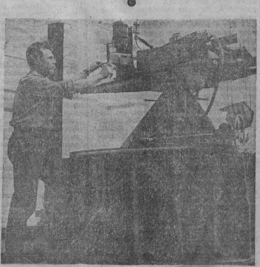
ЛЕНИНГРАД. Турбостроители металлического завода имени XII съезда КПСС ознаменовывают подготовку к 100-летию со дня рождения В. И. Ленина новыми успехами в труде. В эти дни в лаборатории водных турбин проводятся всесторонние исследования модели турбин-гиганта мощностью 650 тысяч киловатт для Саяно-Шушенской ГЭС. Первоначально предполагалось оснестить станцию агрегатами по 540 тысяч киловатт каждый. Но при испытании модели в лаборатории специалисты обнаружили, что рабочее колесо турбины может дать гораздо большую мощность без увеличения ее размера.

С начала эксплуатации станции уже выработано более 42 миллиардов киловатт-часов дешевой электроэнергии. В честь 100-летия со дня рождения В. И. Ленина коллектив Иркутской ГЭС обязался ежегодно добывать столько же собственной энергии на 17 процентов, сокращать время капитального ремонта агрегатов на 3—5 суток, а к 1970 году — ввести так называемую бесконтактную схему автоматики агрегатов.