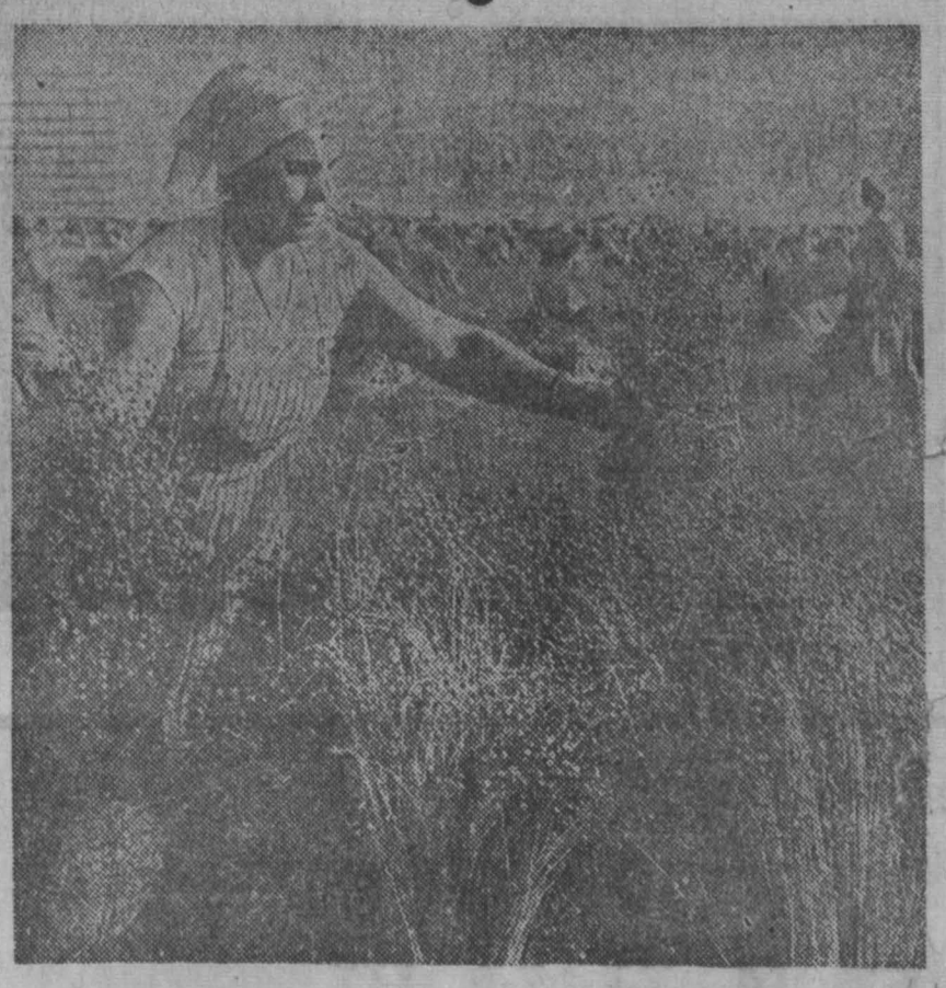
Колхоз «Красный партизан» Дубровского района славится в Брянской области высокими урожаями льна. В этом году, несмотря на неблагоприятные погодные условия, хозяйство получает по 6—7 центнеров семян с гектара.

НЕДЕЛЯ ПОЛЬСКОЙ КНИГИ началась 24 сентября в Новосибирске, телеграфирует корреспондент ТАСС. Издания ПНР по различным отраслям точных наук, естествознания, социологии, художественная и детская литература широко представлены в магазине «Дружба». Среди первых покупателей — ученые из Академгородка и новосибирских вузов. Выставка-продажа польских книг вызвала большой интерес новосибирцев.