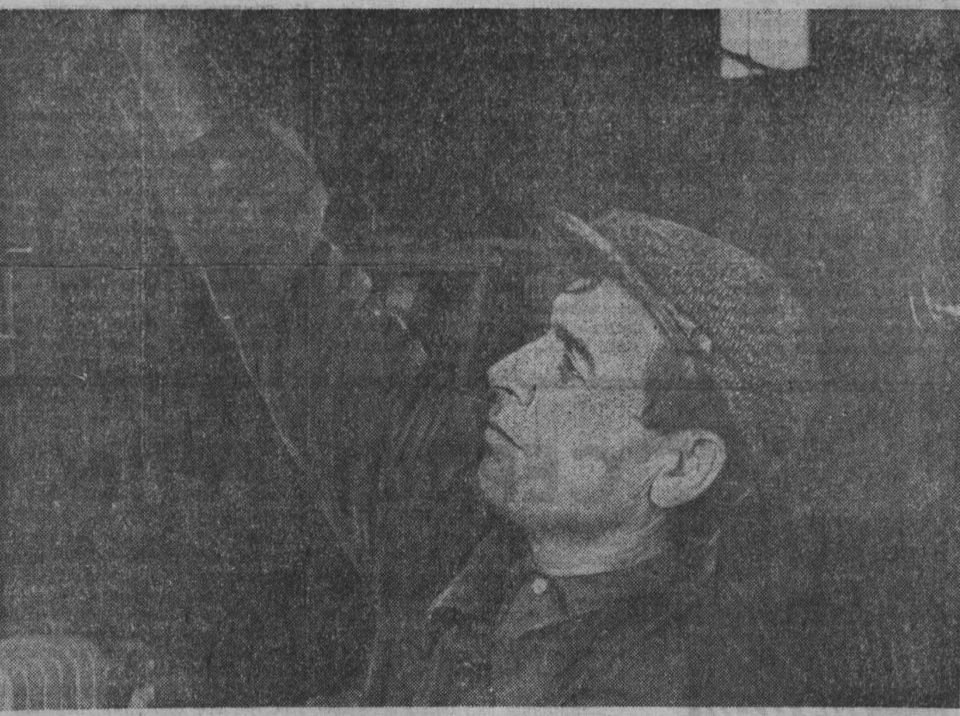
Драга — плавающая фабрика золота. Так обычно называют этот агрегат, сложный по конструкции и эксплуатации.