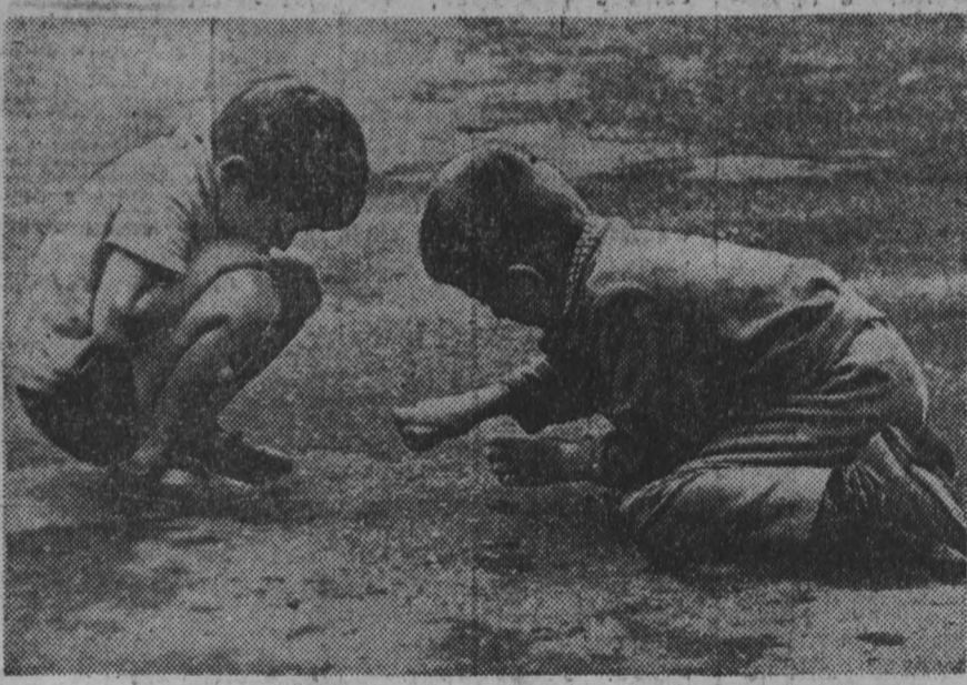
А. Котышев. ДЕТИ.