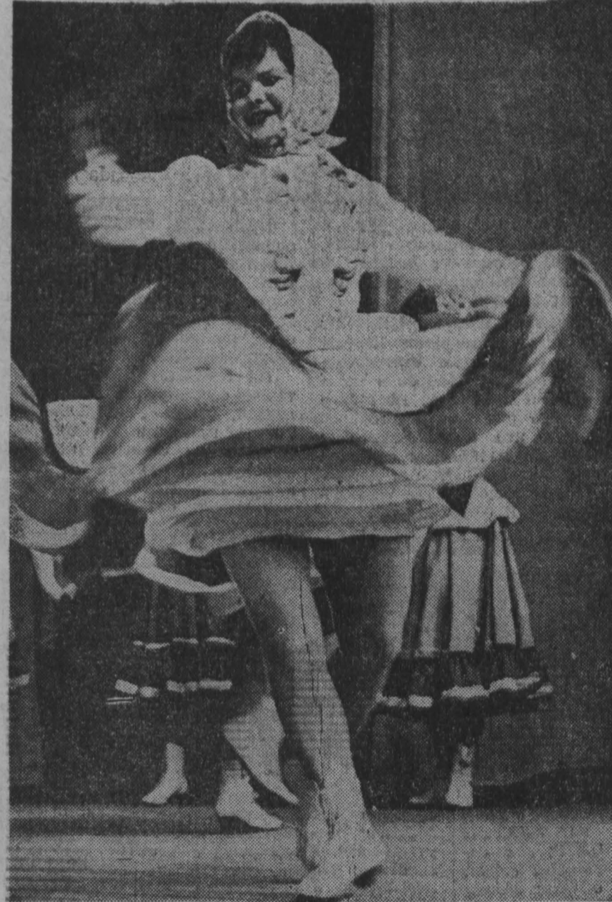
В. Сергеев. ТАНЕЦ.