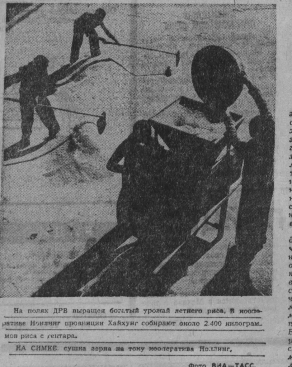
На полях ДРВ выращен богатый урожай летнего риса. В кооперативе Инчипит провинции Хайхунг собирают около 2.400 килограмм риса с гектара. НА СНИМКЕ: сушка зерна на том же кооперативе Инчипит.

ПРАГА, 12 сентября. (ТАСС). Как сообщает агентство ЧТК, вчера в Братиславе состоялась седьмая сессия Президиума ЦК Компартии Словакии. Первый секретарь ЦК КПС Г. Гусак информировал Президиум о результатах чехословацко-советских переговоров в Чехословакии и в Москве. Из проведенных до сих пор переговоров вытекает, что последовательное выполнение московских соглашений создает предпосылки для постепенной консолидации всей политической и общественной жизни. Президиум принял решение образовать рабочую группу, которая вместе с Президиумом ЦК КПС завершит разработку проблематики национальных меньшинств и предложит ее на обсуждение одному из предстоящих пленумов ЦК КПС. На Президиуме обсуждалось также современное положение в печати, радио и телевидении. Многие газеты и журналы не в достаточной степени поддерживают усилия руководства партии и правительства по соблюдению московских соглашений, публикуют статьи, которые вызывают ошарашивание трудящихся ЧССР по поводу дальнейшего развития. В случае, если это положение сохранится и впредь, партийные и государственные органы должны будут принять в отношении работников печати строгие партийные и административные меры.