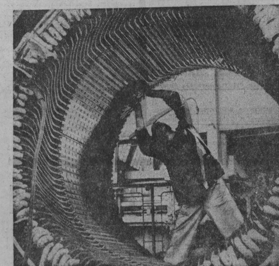
Далеко вперед шагнула за годы народной власти Болгария в своем индустриальном развитии. На снимке: монтаж статора на машиностроительном заводе в Софии.

В ту пору, когда через поселок «станция Обь» проезжал в ссылку Ильич, здесь, в железнодорожном лесу, лишь зарождался первый марксистский кружок. Сегодня в городской партийной организации Новосибирска — 70.000 коммунистов.