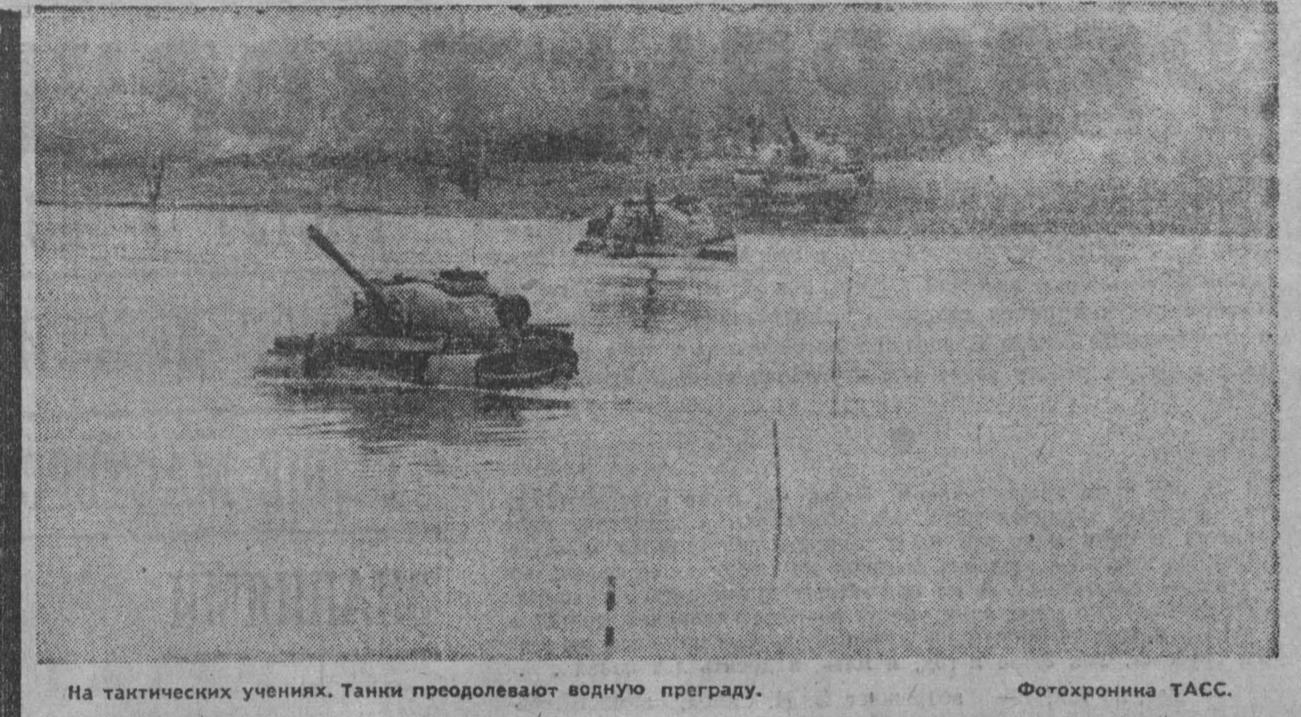
На тактических учениях. Танки преодолевают водную преграду.

Однако ряд чехословацких местных органов и лиц преднамеренно слеркивал, а в отдельных случаях и саботировал приемку грузов из СССР с тем, чтобы вызвать трудности в народном хозяйстве Чехословакии и затем спекулировать на них в целях враждебных интересов обеих стран.