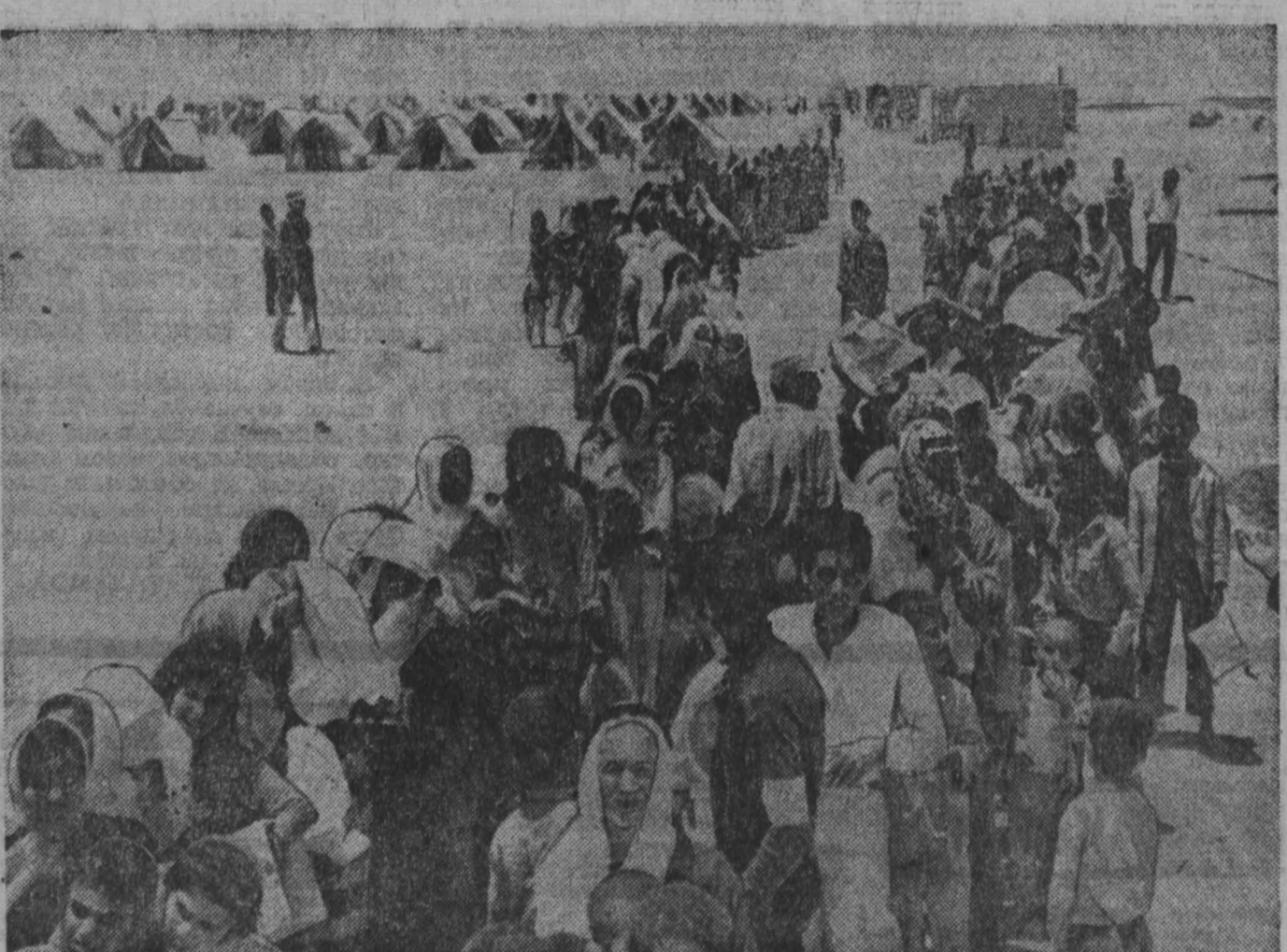
ИОРДАНИЯ. В результате израильской агрессии тысячи иорданских семей были вынуждены покинуть родные места и поселиться в палаточных городках, построенных правительством Иордании.

Важную роль Лейпцигской ярмарки в деле развития мировой торговли отмечают и представители капиталистических стран.