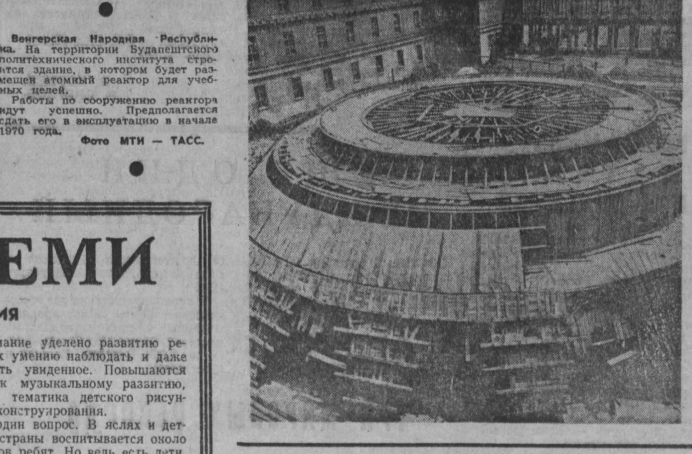
Венгерская Народная Республика. На территории Будапештского политехнического института строится здание, в котором будет размещен атомный реактор для учебных целей.

В Иране был объявлен односторонний национальный траур по жертвам землетрясения.