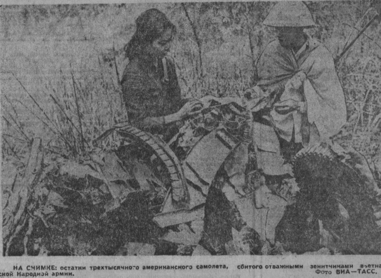
НА СНИМКЕ: останки трехтысячного американского самолета, сбитого отравляющим землетрясением вьетнамской Народной армии.